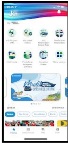
Gambar 1. Tampilan Aplikasi Mobile JKN