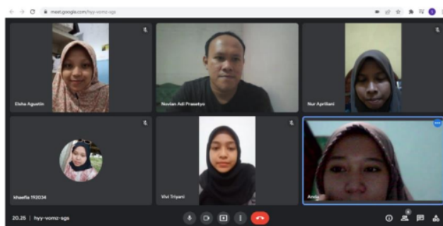
Gambar 4. Kegiatan diskusi daring dengan Mahasiswa Kampus Mengajar 3

Observasi dilakukan secara luring oleh mahasiswa kampus mengajar 3, pada gambar 3 merupakan dokumentasi proses observasi yang dilakukan pada sekolah. Hasil observasi yang dilakukan selama 1 bulan menunjukkan bahwa pemahaman teknologi yang kuasai oleh guru sangatlah terbatas, hal tersebut didukung dengan hanya tersedianya 1 perangkat komputer yang jarang digunakan.