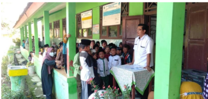
Gambar 3. Kegiatan Observasi oleh Mahasiswa Kampus Mengajar 3

Observasi dilakukan secara luring oleh mahasiswa kampus mengajar 3, pada gambar 3 merupakan dokumentasi proses observasi yang dilakukan pada sekolah. Hasil observasi yang dilakukan selama 1 bulan menunjukkan bahwa pemahaman teknologi yang kuasai oleh guru sangatlah terbatas, hal tersebut didukung dengan hanya tersedianya 1 perangkat komputer yang jarang digunakan.