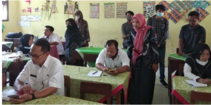
Gambar 7. Praktik Pelatihan Google Form

Bersarkan hasil survei kepuasan yang dilakukan setelah kegiatan ini selesai dapat dilihat pada tabel 2, data tersebut menunjukkan dampak pengabdian masyarakat yang dilakukan bahwa para guru merasa puas dan memberikan komentar yang positif dengan hasil pengabdian masyarakat yang telah dilakukan oleh dosen Institut Teknologi Telkom Purwokerto bersama mahasiswa kampus mengajar 3.