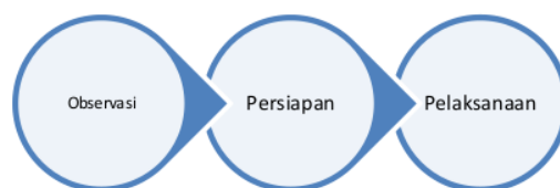
Gambar 2. Metode Pelaksanaan Pengabdian Masyarakat

Metode pelaksanaan yang dilakukan pada pengabdian masyarakat ini merupakan bentuk kegiatan yang di selenggarakan oleh mahasiswa kampus mengajar angkatan 3 dan dosen pembimbing lapangan yang berasal dari Institut Teknologi Telkom Purwokerto. Kegiatan ini berlangsung dengan tahapan seperti pada gambar 2.