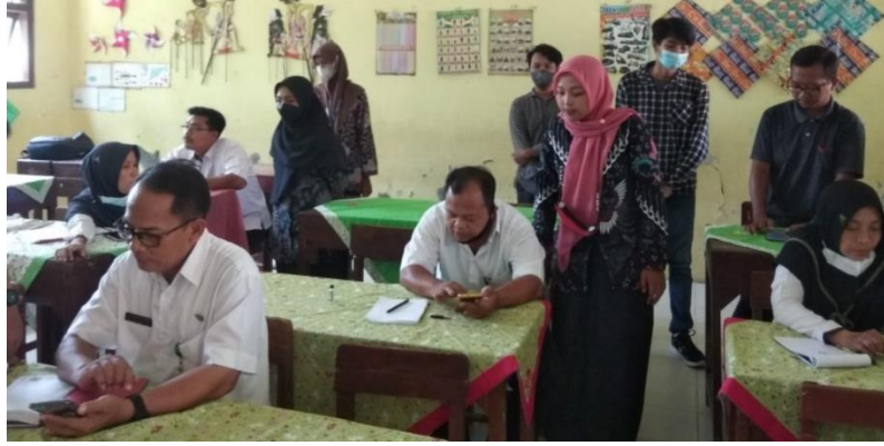
Gambar 7. Praktik Pelatihan Google Form

Bersarkan hasil survei kepuasan yang dilakukan setelah kegiatan ini selesai dapat dilihat pada tabel 2, data tersebut menunjukkan dampak pengabdian masyarakat yang dilakukan bahwa para guru merasa puas dan memberikan komentar yang positif dengan hasil pengabdian masyarakat yang telah dilakukan oleh dosen Institut Teknologi Telkom Purwokerto bersama mahasiswa kampus mengajar 3.