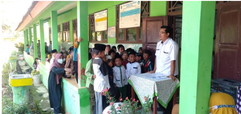
Gambar 3. Kegiatan Observasi oleh Mahasiswa Kampus Mengajar 3

Observasi dilakukan secara luring oleh mahasiswa kampus mengajar 3, pada gambar 3 merupakan dokumentasi proses observasi yang dilakukan pada sekolah. Hasil observasi yang dilakukan selama 1 bulan menunjukkan bahwa pemahaman teknologi yang kuasai oleh guru sangatlah terbatas, hal tersebut didukung dengan hanya tersedianya 1 perangkat komputer yang jarang digunakan.