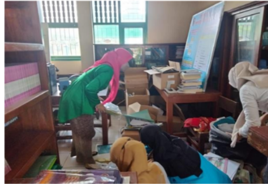
Gambar 1. Melakukan Visitasi Perpustakaan

Buku yang ada di perpustakaan di SMP Negeri 2 Gondangrejo sudah lengkap dan sesuai dengan masing-masing kategori buku. Terdapat buku penunjang dan buku pelajaran di perpustakaan. Buku penunjang yaitu buku fiksi dan buku nonfiksi. Buku dapat menjadi jembatan kita untuk melihat dunia luar yang tidak bisa disentuh langsung (Sunanda dkk., 2020). Dengan adanya fasilitas yang diberikan oleh sekolah kepada siswa SMP Negeri 2 Gondangrejo maka terjadi peningkatan literasi membaca di perpustakaan SMP Negeri 2 Gondangrejo. Berdasarkan dari revitalisasi perpustakaan yang dilakukan di SMP Negeri 2 Gondangrejo dapat meningkatkan minat membaca atau literasi di perpustakaan. Dengan kondisi yang nyaman dan rapi siswa yang awalnya hanya sedikit peminatnya maka sekarang minat yang datang ke perpustakaan semakin banyak.