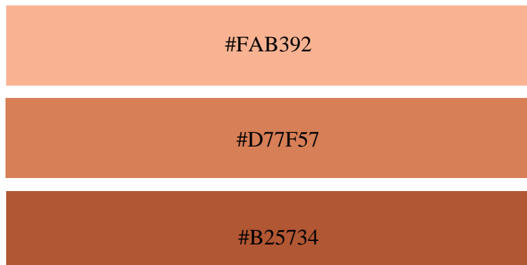
Gambar 4.2 Palet Warna

Pemilihan warna oranye ini berdasarkan dengan warna kucing yang paling banyak dikenali yaitu kucing oranye seperti contohnya pada film “Garfield”. Kucing dengan warna oranye memiliki beberapa hal spesial dibandingkan dengan kucing lain salah satunya adalah perbedaan jumlah jantan dan betina yang tidak setara [31]. Selain itu warna oranye memiliki karakter aktif, hangat, dan mudah bergaul [35]. Karakter dari warna oranye tersebut memiliki kecocokan dengan karakter dari kucing.