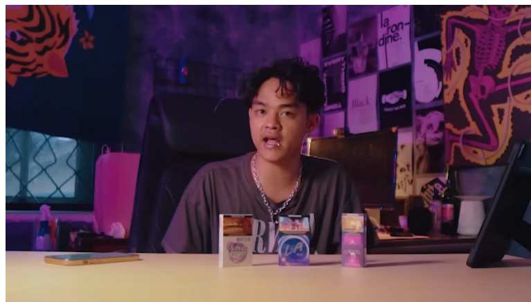
Gambar 2. 4 Hasil Produksi Sponsor Video