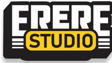
Gambar 2. 1 Logo Perusahaan

Erere Studio adalah perusahaan Creative Agency yang masuk dalam badan hukum perseroan PT. Sanjaya Harsa Abadi yang sudah berdiri sejak tahun 2019 dengan ruang lingkup kegiatan usaha entertainment company yang bergerak di bidang pembuatan konten digital melalui media sosial.