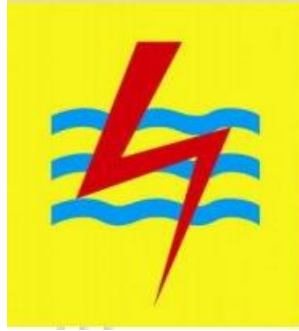
Gambar 1.1 Logo PT. PLN (Persero) [2]