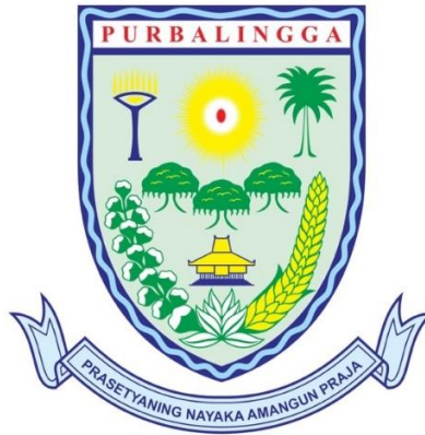
Gambar 1. 1. Logo Dinas Kominfo Kabupaten Purbalingga

Dinas Komunikasi dan Informatika merupakan sebuah organisasi perangkat daerah yang membidangi penyebarluasan informasi, pengembangan dan pendayagunaan TIK serta pengendalian layanan jasa pos dan telekomunikasi dituntut mampu memberikan pelayanan kepada masyarakat secara transparan dan akuntabel di bidang komunikasi dan informatika[1].