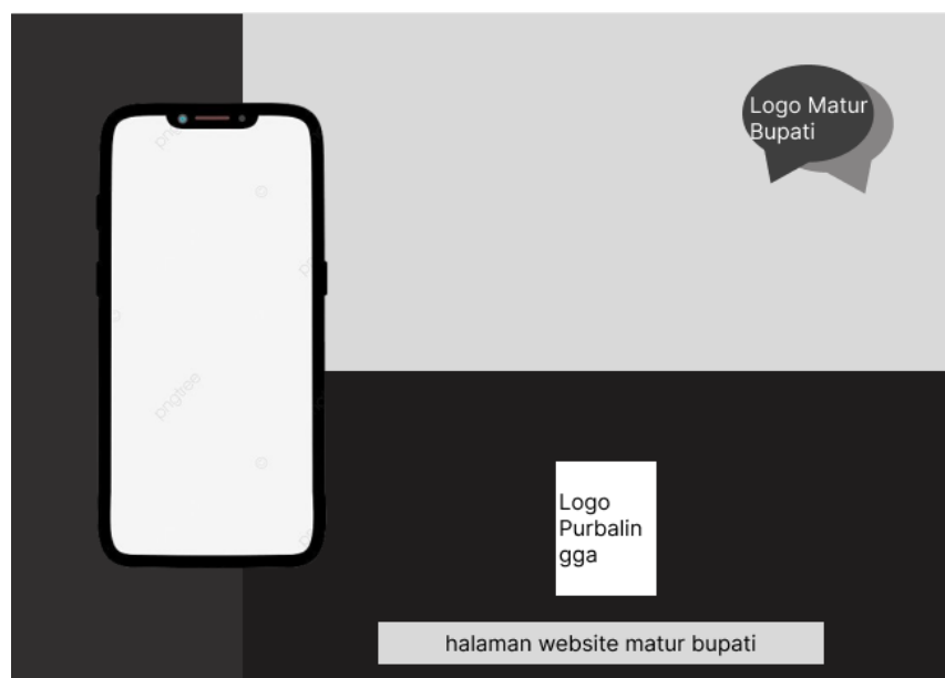
Gambar 3. 3 Low-end Wireframe Flier ketiga

Dan untuk flier ketiga ini, dibuat dengan bentuk lanskap, ini dibuat dengan tujuan dan asumsi bahwa flier ini digunakan pada gedung-gedung ataupun sarana publik yang menyediakan bingkai flier yang berbentuk lanskap sehingga memerlukan flier yang berukuran lebih besar dari flier biasanya. Untuk flier ketiga ini dengan memanfaatkan kelebihan flier bertipe lanskap, maka kami menaruh link daripada website aplikasi Matur Bupati sehingga para audiens memiliki akses lebih cepat dalam membuka website ketimbang mengunduh aplikasinya bisa menuju langsung ke website Matur Bupati.