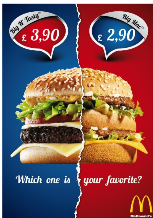
Gambar 2. 1 Contoh Flier

Flier atau yang biasa dikenal poster adalah selebaran persegi yang dicetak dengan tujuan promosi atau pemasaran suatu produk atau layanan, untuk contoh seperti apa Flier itu sendiri, dapat dilihat pada Gambar 2.1 di bawah. Konsep flier ini banyak diminati karena percetakannya yang hemat biaya dan juga bisa dicetak banyak sehingga bisa disebar luaskan ke masyarakat. Adapun bentuk lain dari flier adalah poster daring yang biasanya dipublikasikan melalui sosial media. Penugasan kelompok kami dari Kominfo Kabupaten Purbalingga adalah membuat flier promosi daripada Aplikasi Matur Bupati yang akan dirilis nantinya. Flier kami yang sudah jadi ini nantinya akan dipublikasikan ke akun sosial media daripada Kominfo Kabupaten Purbalingga.