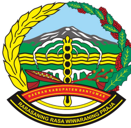
Gambar 1. 1 Logo Dinas Pendidikan Banyumas

Berikut Merupakan Logo Dinas Pendidikan Banyumas.