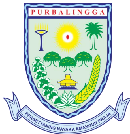
Gambar 1. 1 Logo Bappelitbangda

Bapelitbangda (Badan Perencanaan, Penelitian dan Pengembangan Daerah) adalah kepala badan pimpinan yang mendukung kegiatan pemerintah di bidang perencanaan, penelitian dan pengembangan yang berada dibawah kewenangan Gubernur/Bupati/Wakil kota melalui Sekretaris Daerah. Didalem kantor Bapelitbangda ada struktur susunan organisasi diantaranya: