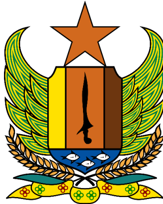
Gambar 1. 1 Logo

Sejarah berdirinya Dinas Pemberdayaan Masyarakat dan Desa. Sejak awal tahun 2000 isu tentang otonomi daerah terus bergulir. Berbagai regulasi telah disiapkan untuk proses penyerahan kewenangan dari pusat ke daerah. Hingga akhirnya pada tahun 2003 urusan atau kewenangan daerah pusat diserahkan sepenuhnya kepada daerah. Sebagai konsekuensi dari penyerahan kewenangan dari pusat, pemerintah daerah harus mengantisipasi dengan membentuk kelembagaan yang akan menangani urusan dan kewenangan tersebut.