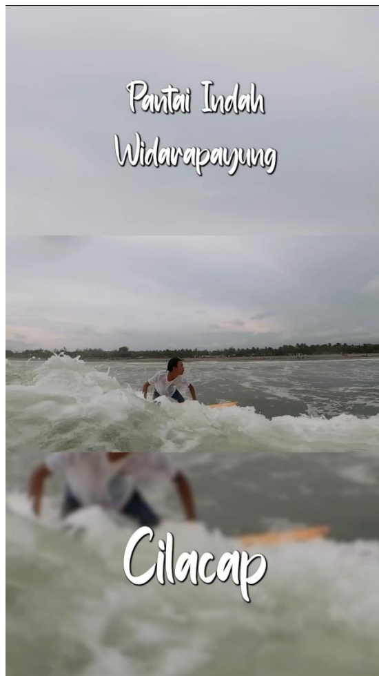
Gambar 5. 4 Desain Cover DVD