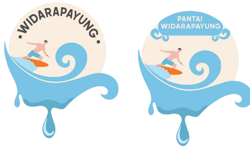
Gambar 5. 5 Desain Gantungan Kunci