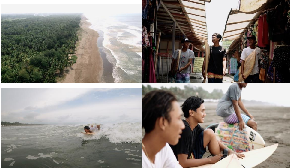
Gambar 5. 1 Screenshot Video

Media : Media Sosial Ukuran : 1080 X 1920 Tipografi : Montesserat dan Bukhari Script Visualisasi : Menampilkan pemandangan sepanjang Pantai Indah Widarapayung