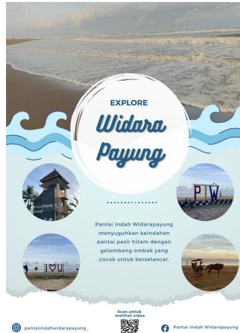
Gambar 5. 2 Desain Poster