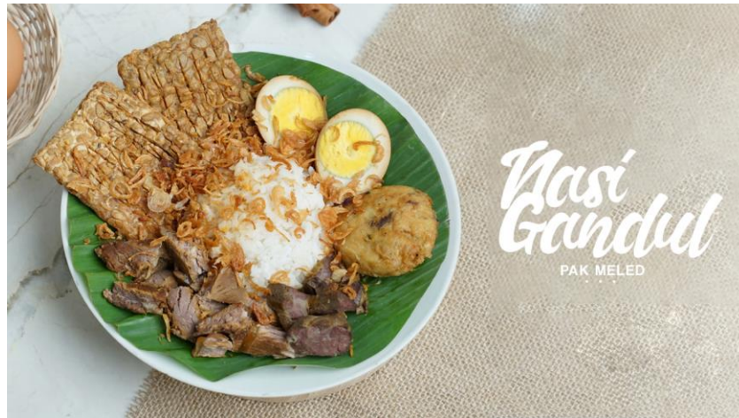
Gambar 21. Video Teaser Nasi Gandul