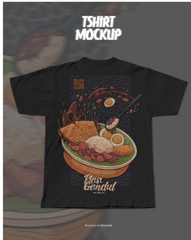
Gambar 20. Desain T-shirt Nasi Gandul