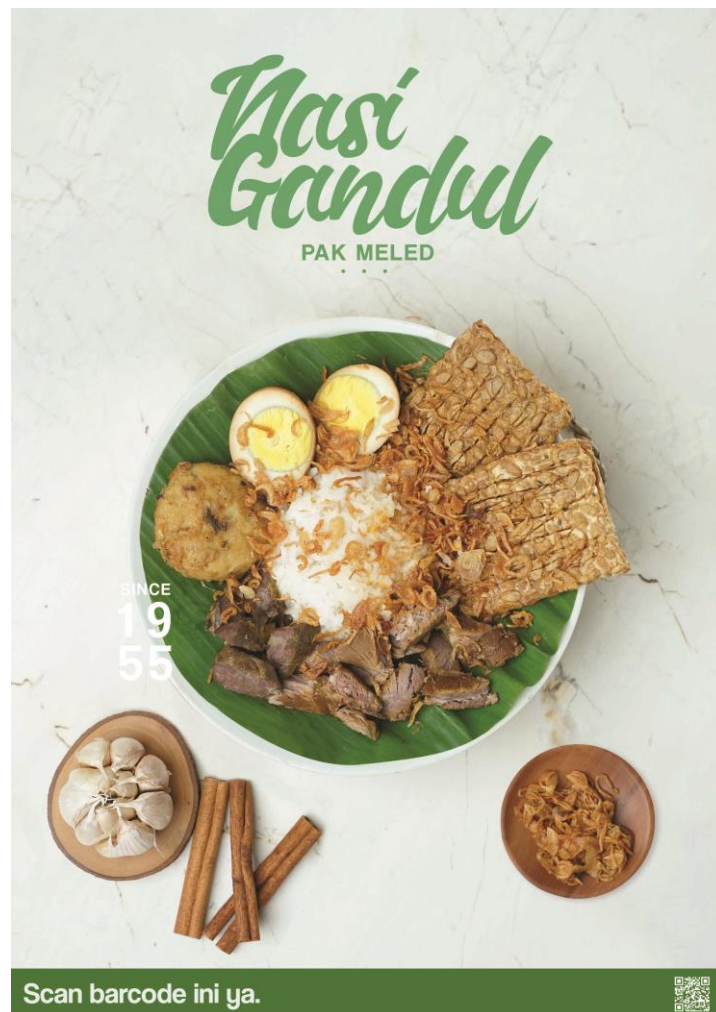
Gambar 17. Desain Poster Nasi Gandul