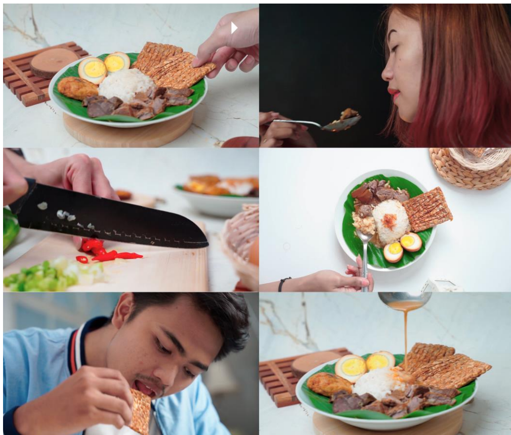
Gambar 16. Media Utama Vidio Iklan Nasi Gandul