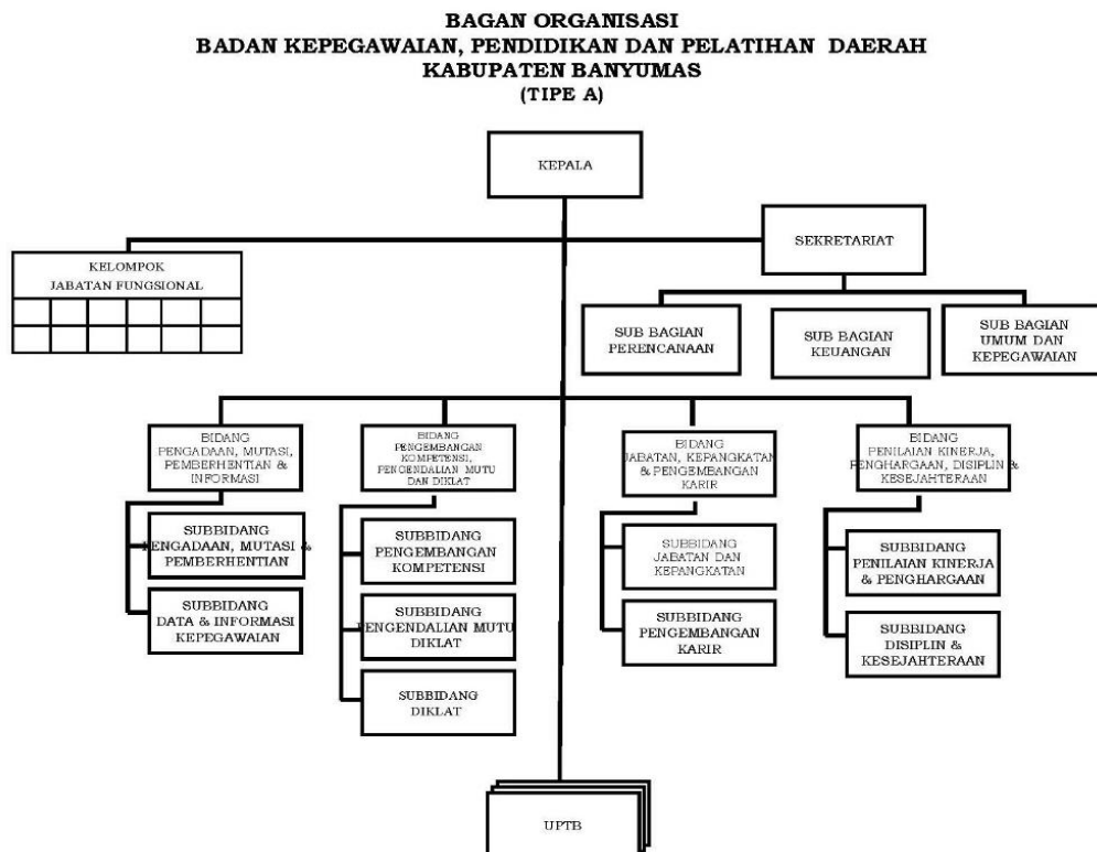
Gambar 3. 1 Struktur Organisasi BKPSDM

Subjek penelitian ini dilakukan di salah satu lembaga pemerintahan yang ada di Purwokerto yaitu Badan Kepegawaian Pengembangan Sumber Daya Manusia (BKPSDM) yang berada di Jl. DR. Soeparno No. 32, Arcawinangun, Purwokerto Timur. Pada Gambar 3.1 akan dilakukan petakan susunan struktur organisasi yang ada di BKPSDM.