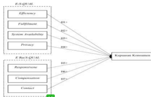
Gambar 1. Kerangka Teori

Pada penelitian ini melakukan analisis kepuasan konsumen terhadap kualitas layanan E-Commerce JD.ID dengan menggunakan tujuh dimensi E-Servqual . Berikut kerangka teori yang akan digunakan pada penelitian ini dapat dilihat pada Gambar 1.