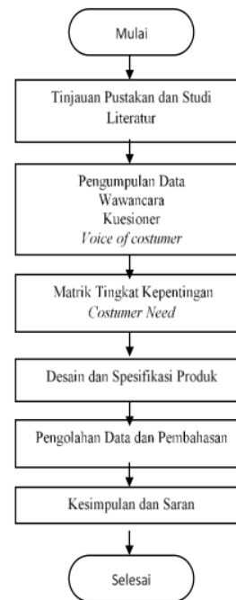
Gambar 1. Diagram Alir Penelitian

digunakan dapat digunakan sebagai alat pengukuran.