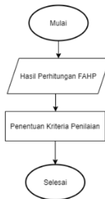
Gambar 5. Diagram Pengolahan Data Simple Additive Weighting

5 Pada Gambar 4 diketahui adalah diagram pengolahan data dari metode fuzzy analytical hierarchy process yang dimulai dengan menentukan kriteria penilaian kemudian setelah memperoleh kriteria penilaian yaitu loading time, response time, page size, accessibility error dan broken link dilanjutkan dengan menyusun matriks perbandingan berpasangan antar kriteria. Selanjutnya menentukan batas low, middle dan upper untuk tiap kriteria perbandingan berpasangan dan dilakukan konversi matriks perbandingan berpasangan ke dalam triangular fuzzy number untuk dilanjutkan ke tahap normalisasi. Setelah dilakukan normalisasi, dilakukannya pembobotan dari hasil normalisasi dan diperolehnya nilai prioritas dari nilai kriteria dengan e-commerce -nya. Setelah itu bobot akan dimasukkan ke dalam nilai dari e-commerce yang diperoleh dari tiga buah tools dan akan menghasilkan perhitun 27 dari metode fuzzy analytical hierarchy process . Selanjutnya dilakukan perangkingan dari hasil pembobotan menggunakan metode simple additive weighting yang dilampirkan pada Gambar 5.