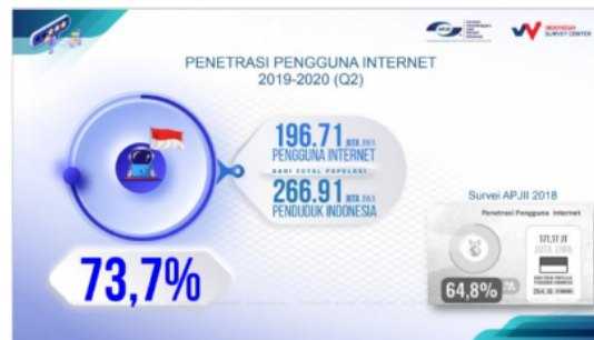
Gambar 1. Hasil survei pengguna internet 2019-2020 [2]

Bersamaan dengan meningkatnya pertumbuhan internet dan e-commerce , data dari penelitian bertajuk “The Opportunity of Indonesia” yang digagas oleh TEMASEK dan Google, pada tahun 2015, terdapat 92 juta pengguna internet dan 18 juta orang pembeli online Indonesia. Pada 2020, diprediksi pengguna Internet Indonesia akan meningkat menjadi 215 juta pengguna. Pada 2025 mendatang, 119 juta orang diprediksi menjadi pembeli online di Indonesia. TEMASEK dan Google memprediksi bahwa nilai pasar e-commerce Indonesia akan mencapai angka $81 miliar pada tahun 2025[1].