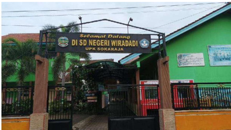
Gambar 3. Lokasi SD Negeri Wiradadi

Dalam pelaksanaan pengabdian masyarakat di SD Negeri Wiradadi berjalan dengan aman dan lancar. Tidak ada hambatan hambatan yang terjadi, kemudian pada penyampaian materi dalam pengabdian ini di lakukan selama 180 menit dengan cara bergantian setiap materi 30 menit. Adapun pembagiannya yaitu menjadi 6 sesi.