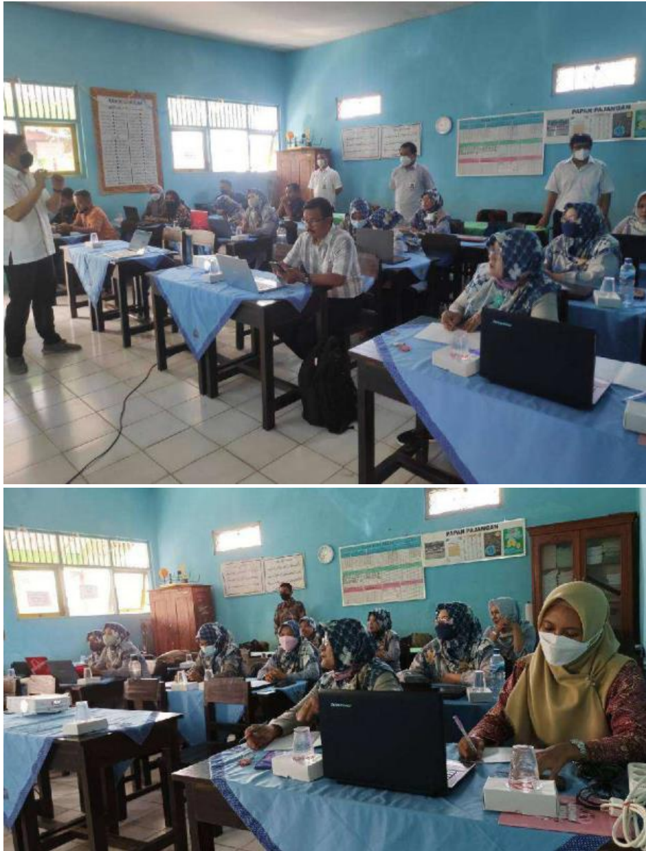
Gambar 2. Kegiatan pengabdian sedang berlangsung

mahasiswa. Dalam hal ini peserta sangat antusias mengikuti pelatihan powerpoint dikarenakan dapat menambah referensi guru dalam metode pengajaran.