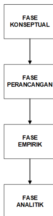
Gambar 1. Tahapan penelitian

Metode yang digunakan pada penelitian ini adalah metode penelitian kuantitatif. Menurut Polit D.F. & Hungler B.P. (1999) metode penelitian kuantitatif memiliki tahapan-tahapan seperti yang terlihat pada Gambar 1 .