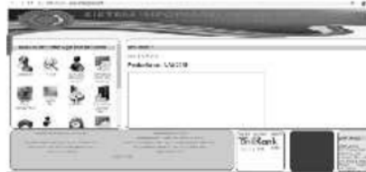
Gambar 1. Halaman Login pada SIAKAD

Link utama Sistem Informasi Akademik (SIKAD) dapat diakses melalui alamat www.siakad.umb.ac.id maupun link IP Publik http://163.53.187.xxx/umb/ .