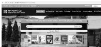
Gambar 2. Halaman home sistem perpustakaan

Tampilan login sistem perpustakaan tentu berbeda dengan sistem akademik, namun begitu data isian yang digunakan sama. Gambar 2. Menunjukkan tampilan login pada website perpustakaan UMB.