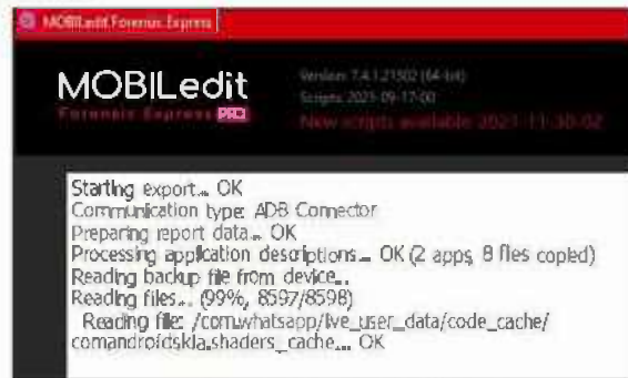
Gambar 4. Proses Akuisisi Data

Dilihat pada Gambar 4 bahwa proses akuisisi data pada percobaan ini dapat membaca 8598 file yang akan di ekstrak dalam bentuk Microsoft Excel, HTML, dan PDF. Berikut hasil data yang didapatkan pada percobaan ini dengan ponsel dalam kondisi Non Root .