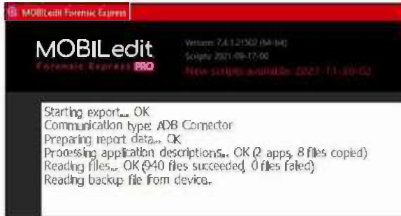
Gambar 3. Proses Akuisisi Data

Dilihat pada Gambar 3 bahwa proses akuisisi data pada percobaan MOBILedit ini dapat membaca 940 file yang akan di ekstrak dalam bentuk Microsoft Excel, HTML, dan PDF. Berikut hasil data yang didapatkan pada percobaan ini dengan ponsel dalam kondisi Non Root .