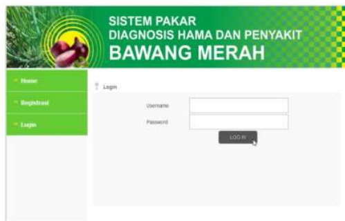
Gambar 4. Halaman Login