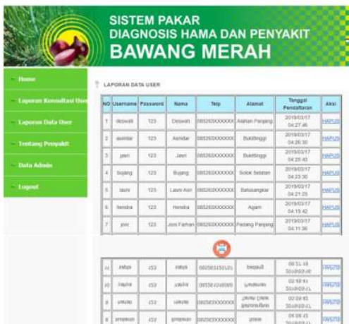
Gambar 8. Halaman Laporan Data User

Tampilan Halaman Laporan Data User dan Cetak Laporan dapat dilihat pada gambar 8.