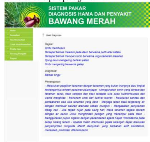
Gambar 7. Halaman Hasil Konsultasi User

Tampilan halaman hasil konsultasi user menampilkan hasil jawaban user dari gejala yang dialami user tentang hama dan penyakit bawang merah. Halaman hasil konsultasi user dapat dicetak dengan mengklik menu cetak hasil konsultasi seperti pada gambar 7.