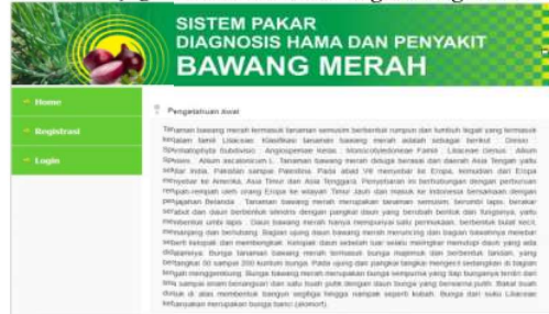
Gambar 2. Tampilan Halaman Home

Halaman menu home adalah halaman pertama yang ditampilkan ketika program ini dijalankan. Pada halaman tersebut ditemukan beberapa menu yang dibutuhkan, halaman ini juga berisi informasi tentang bawang merah.