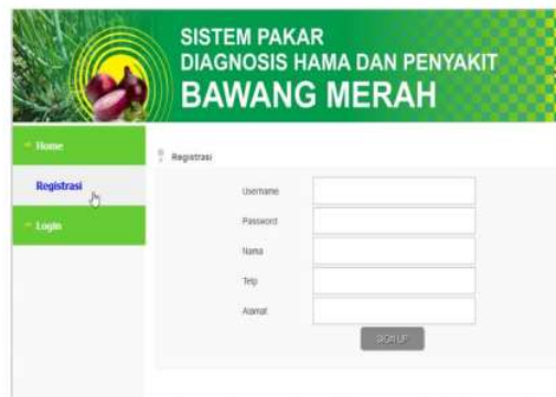
Gambar 3. Halaman Registrasi

Halaman ini berisikan tentang proses registrasi sebelum melanjutkan ke proses login dengan mengisi form yang disediakan terlebih dahulu. Setelah melakukan proses registrasi, user akan langsung dihadapkan ke halaman login dan user diminta untuk melakukan login .