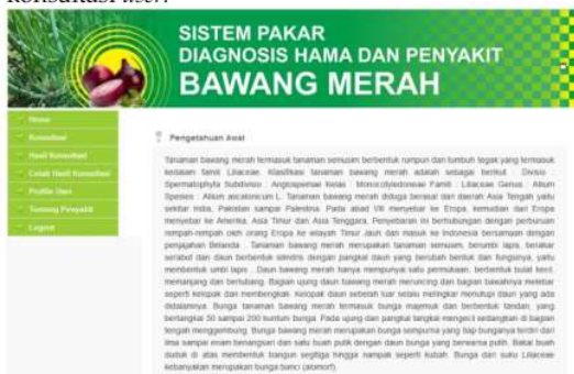
Gambar 5. Halaman Home User

Gambar 5 adalah tampilan halaman home user yang berisikan menu menu untuk kebutuhan konsultasi user.