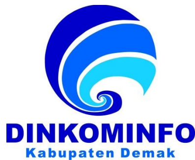
Gambar 1.4.1 Logo Dinkominfo Kab.Demak [1]

Dinas Kominfo bersetatus Tipe B yang dipimpin oleh Kepala Dinas dibantu oleh Sekretaris Dinas dan 3 Bidang dan 8 SUB koordinator termasuk didalamnya LPPL ( Lembaga Penyiaran Publik Lokal ) RSKW FM (Radio Suara Kota Wali ). Dinas Komunikasi dan Informatika Kab. Demak terbentuk atau berdiri pada Januari 2017 sebelumnya ( Dinas Kominfo) tergabung dalam bagian dari Dinas Perhubungan dengan nomenklatur Dishub Kominfo dan saat itu Kominfo berupa Bidang yang merupakan bagian dari Dishub dan dipimpin oleh kepala bidang, sejak Januari 2017 yang berdasarkan SOT (Struktur Organisasi Tata kerja) yang baru Dinas Kominfo berdiri sendiri dipimpin oleh seorang kepala dinas hingga saat ini (2022). Dengan Alamat Kantor Jl. Sultan Hadiwijaya No.4, Nogorame, Mangunjiwan, Kec. Demak, Kabupaten Demak, Jawa Tengah 59511.