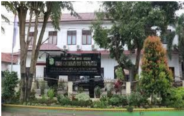
Gambar 1. 2 Kantor Dinas Komunikasi dan Informatika

Terwujudnya masyarakat Kota Medan yang berkah, maju dan kondusif dan aman tentram serta damai sentosa selama-lama nya.