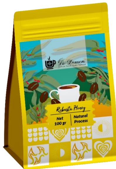
Gambar 5. 1 Kemasan Primer Robusta Honey