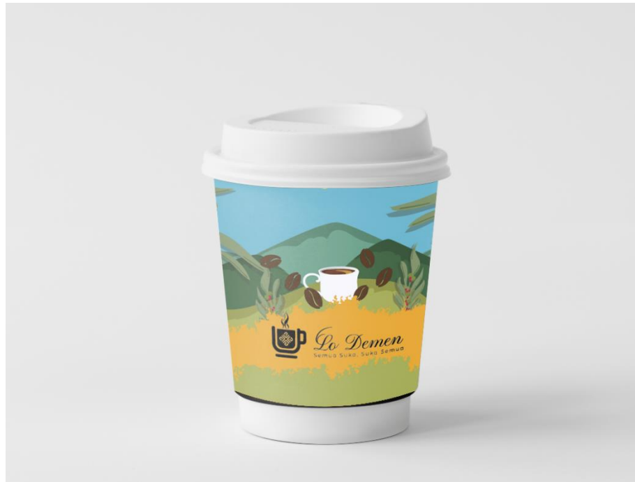
Gambar 5. 8 Cup Kopi