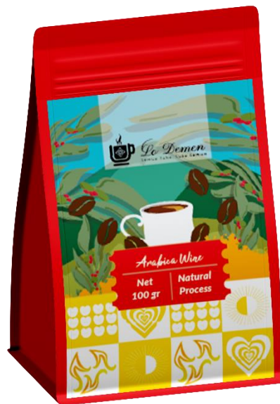
Gambar 5. 2 Kemasan Primer Arabica Wine [Sumber: Hasil Desain Penulis]