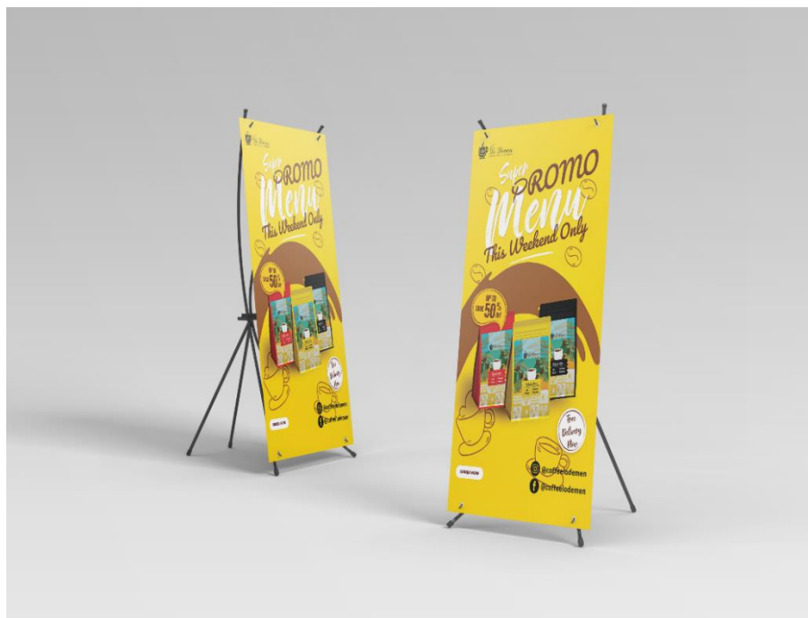
Gambar 5. 7 X-Banner