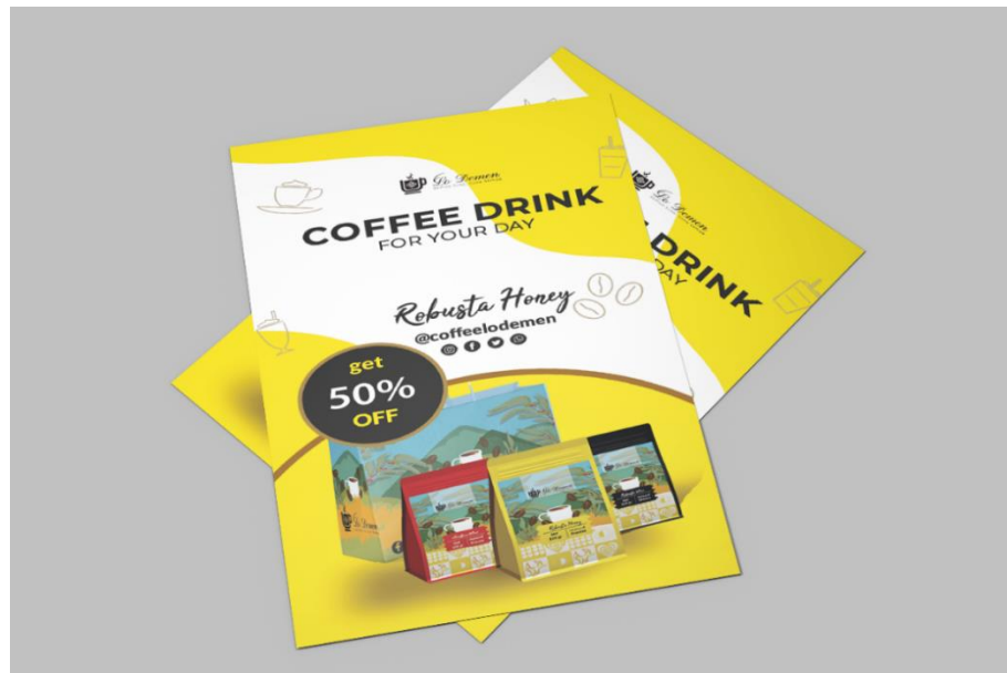
Gambar 5. 6 Poster