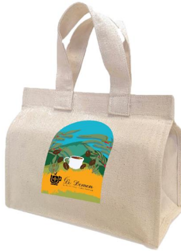
Gambar 5. 9 Tote Bag