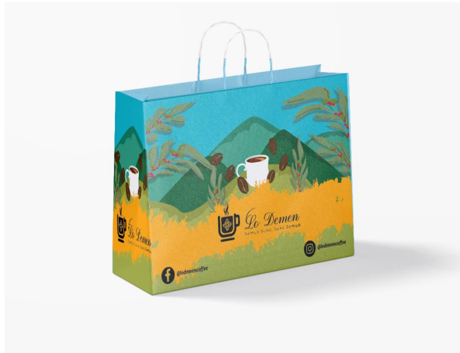
Gambar 5. 4 Kemasan Sekunder