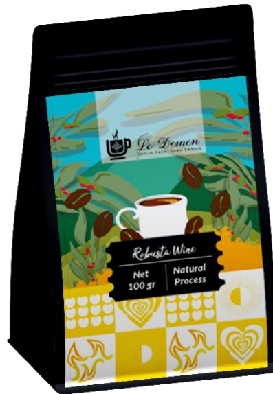
Gambar 5. 3 Kemasan Primer Robusta Wine