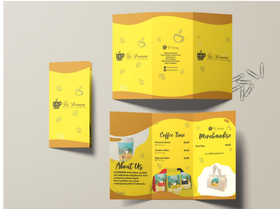
Gambar 5. 5 Brosur