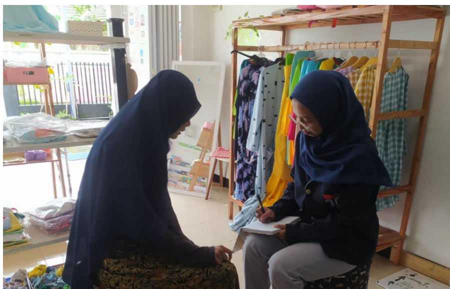
Gambar 1. 1 Wawancara dengan Owner Ghaniza Store

Ghaniza Store merupakan toko yang bergerak dalam bidang penjualan, yang berdiri sejak tahun 2016. Memiliki 5 karyawan yang bertugas untuk mengurus menjaga toko dan administrasi penjualan. Toko ini menjual berbagai macam perlengkapan bayi dan anak seperti hampers, pakaian, buku, tas, alat main dan lain-lain, selain berjualan secara online toko ini juga memiliki toko offline yang terletak pada Jl. Gunung Kelir no. 36 Purbalingga Kulon, Purbalingga.