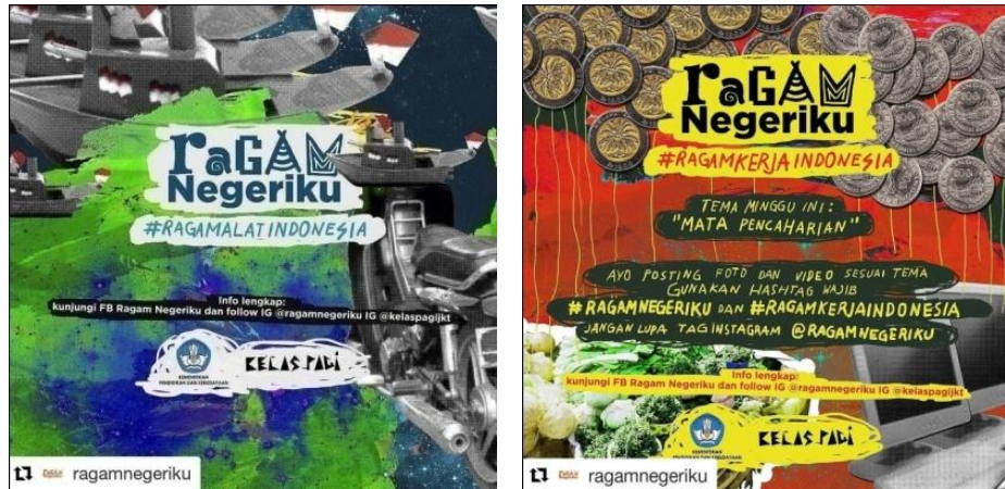
Gambar 8 Ragam Negeriku

Ragam Negeriku adalah kolaborasi Kemendikbud dengan Kelas Pagi sebagai gerakan cinta keberagaman Indonesia via Instagram. Tujuannya mengajak para pengguna sosial media menghargai perbedaan sebagai kekayaan Indonesia, bukan alasan untuk terpecah belah, karena Indonesia Indah ddalam keberagamannya. Ragam negeriku mengadakan sebuah lomba foto dan video, lomba yang diadakan memiliki ketentuan tema mingguan dan tema besar yang dimana beberapa orang yang lolos karyanya akan ditampilkan di pameran Pekan Seni Media 2017 dan hadiah sebuah paket perjalanan wisata budaya Indonesia bagi para pemenang lomba.