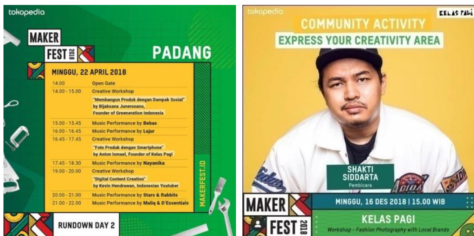
Gambar 6 Maker Fest