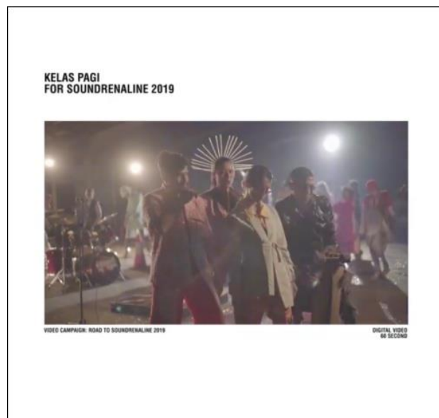
Gambar 7 Soundrenaline 2019

Kelas pagi bekerjasama dengan Soundrenaline 2019 dengan sebuah video campaign yang berdurasi 60 detik untuk kebutuhan video looping dalam acara road to soundrenaline 2019. Menyatukan 2 generasi dalam 1 cerita, menjadi sebuah tantangan tersendiri bagi tim dalam memperhatikan tiap detail elemen wardrobe, props, koreografi, lagu, dan gaya visualnya, agar informasi yang ingin disampaikan bisa tersampaikan dengan baik bagi audiens .