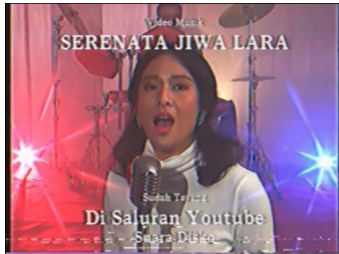
Gambar 10 Diskoria Seleкта

Kelas Pagi dan Third Eye Space dilibatkan dalam proses pembuatan musik video “serenata jiwa lara” bersama Dian Sastro yang diciptakan oleh Lale Ilmaino. Dengan menjalankan projek ini turut membantu irama nusantara dalam mengarsipkan lagu populer Indonesia.