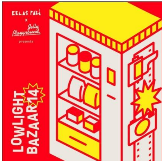
Gambar 5 Lowlight Bazaar 14

Kelas pagi bekerjasama dengan Jellyplayground pada acara bazaar tahunan Jellyplayground yaitu Lowlight Bazaar 14. Lowlight Bazaar adalah bazaar untuk para penggemar fotografi film, seperti analog, polaroid, dsb. Lowlight bazaar juga diisi dengan workshop , dan talkshow dari para fotografer. Kelas pagi memproduksi sebuah kaos sebagai merchandise khusus pada event ini.