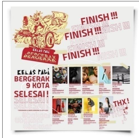
Gambar 9 Kelas Pagi Bergerak

Kelas Pagi bekerjasama dengan A Mild dengan mengadakan workshop tour di berbagai kota di Indonesia. Event ini diselenggarakan pertama kali pada tahun 2017 yang di selenggarakan di 13 kota.