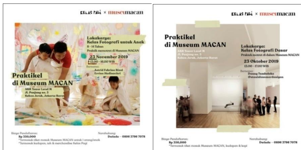
Gambar 4 Kelas Pagi x Museum Macan