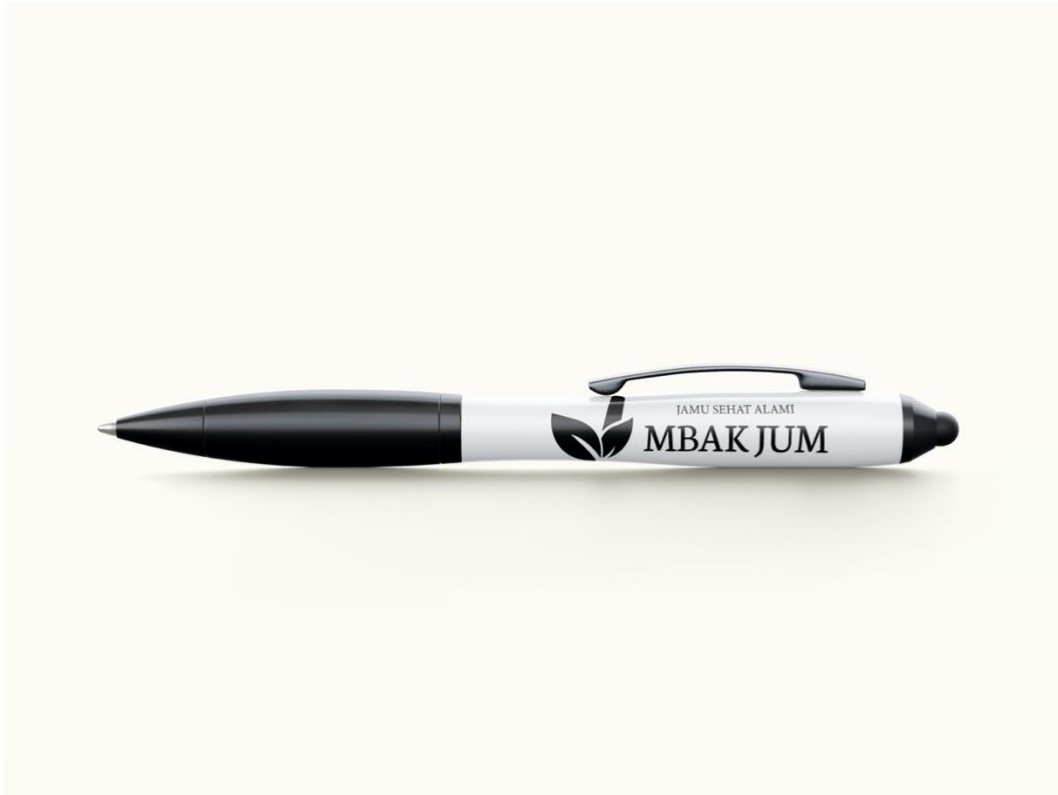
Gambar 5. 7 Desain Pulpen

Media : Plastik Penempatan : Pulpen Ukuran : - Tipografi : Agane, Minion Variable Concept Visualisasi : Adobe Illustrator 2020