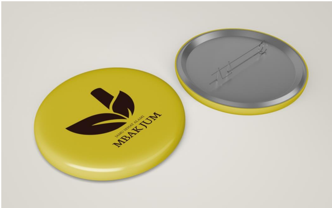
Gambar 5. 6 Desain Pin Bros

Media : Plastik Penempatan : Pin Ukuran : 5,8 cm Tipografi : Agane, Minion Variable Concept Visualisasi : Adobe Illustrator 2020