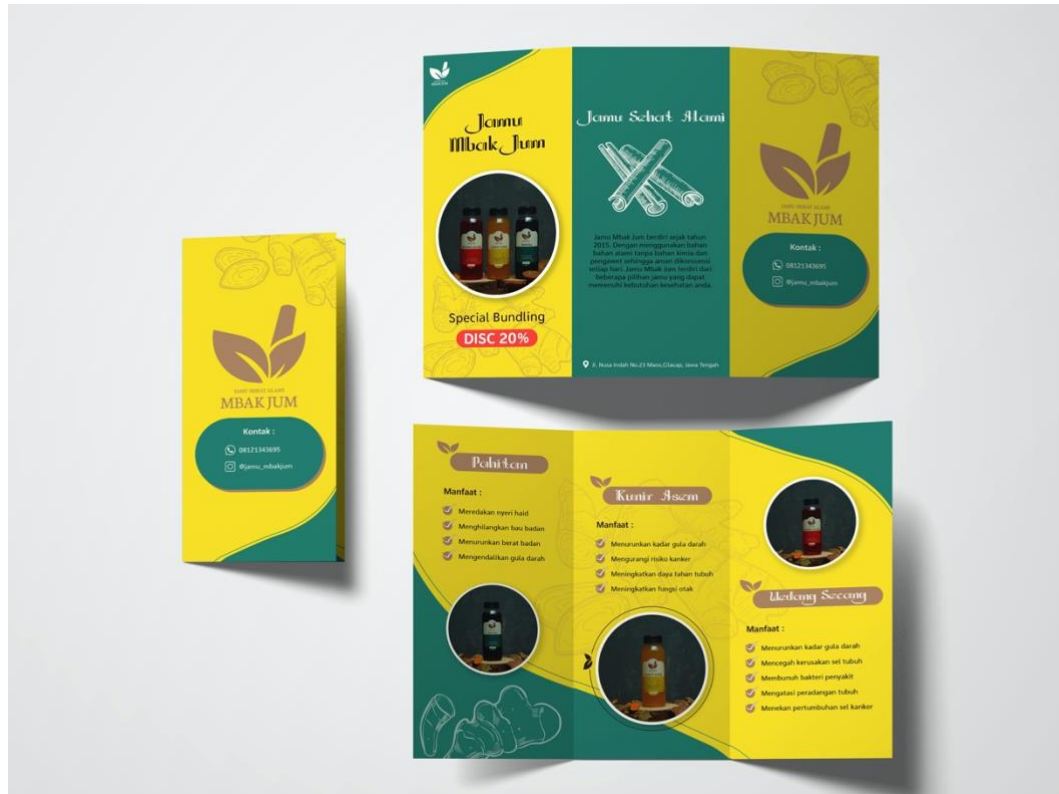
Gambar 5. 2 Desain Brosur