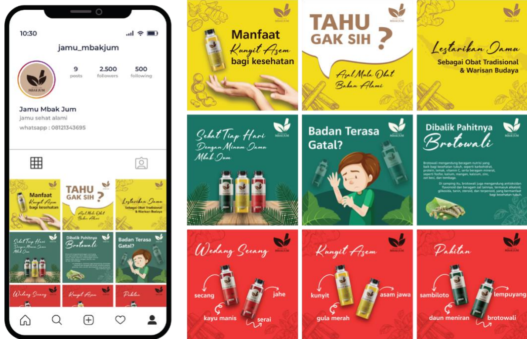
Gambar 5. 1 Desain Feeds Instagram