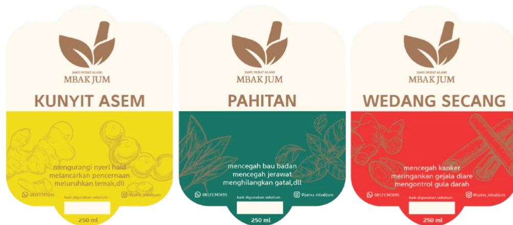
Gambar 5. 8 Label Kemasan