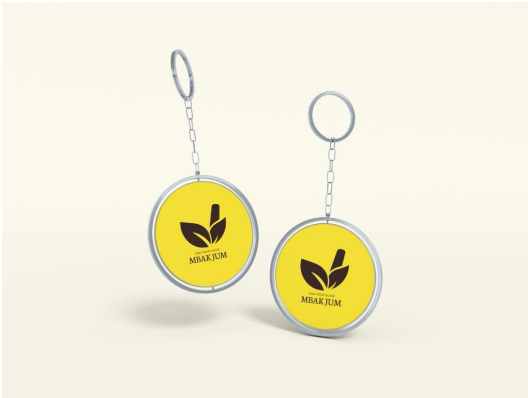
Gambar 5. 9 Desain Gantungan Kunci