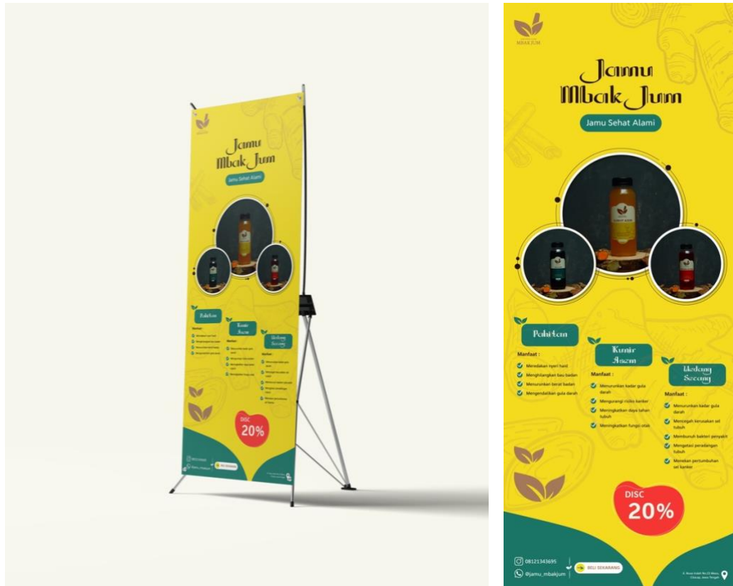
Gambar 5. 3 Desain X-Banner