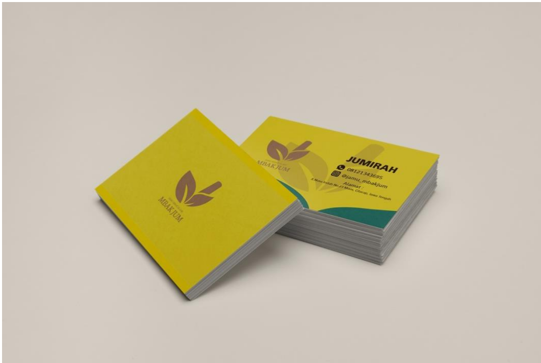
Gambar 5. 4 Desain Kartu Nama

Media : Art Carton 230gr Penempatan : Kartu nama Ukuran : 5 x 8,8 cm Tipografi : Agane Visualisasi : Adobe Illustrator 2020