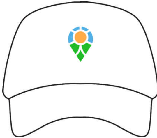
Gambar 5.4.1 Topi