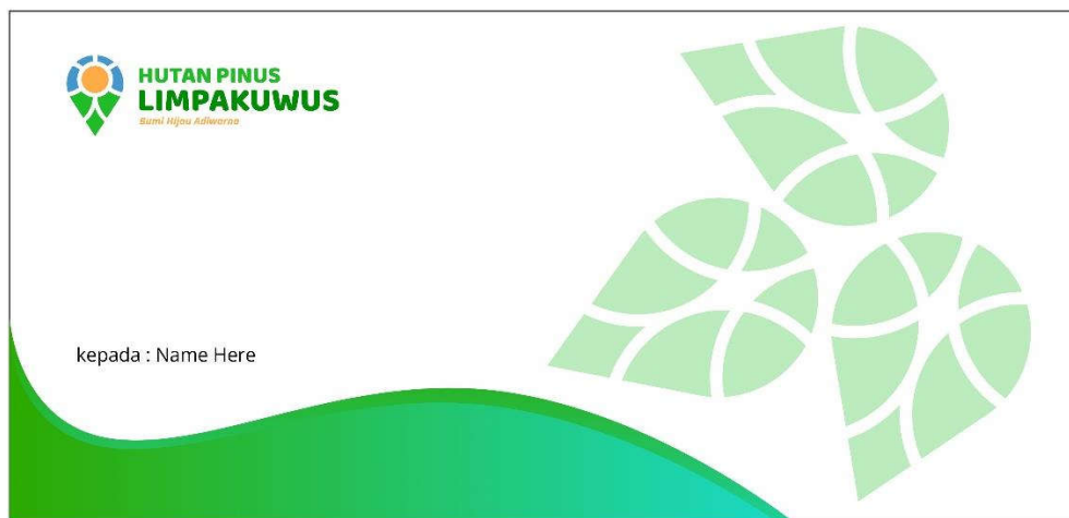
Gambar 5.15.1 Envelope

Media : Envelope Ukuran : 10 x 21 Cm Penempatan : Kantor Pengawas Ilustrasi : Logo Hutan Pinus Limpakuwus dan Foto Tipografi : Ballo Bhaijan 2, Open Sans Visualisasi : Adobe Illustratir CC