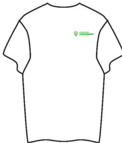
Gambar 5.7.1 Kaos