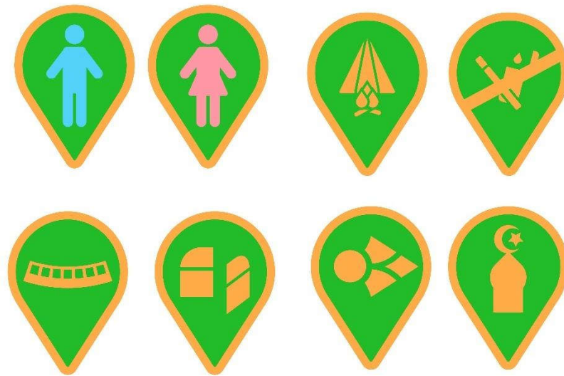
Gambar 5.12.1 Signage