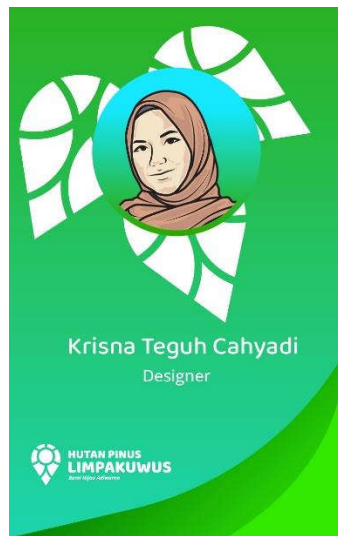
Gambar 5.10.1 ID Card