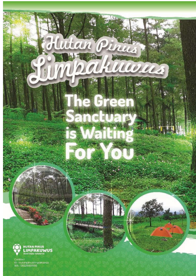
Gambar 5.11.1 Poster