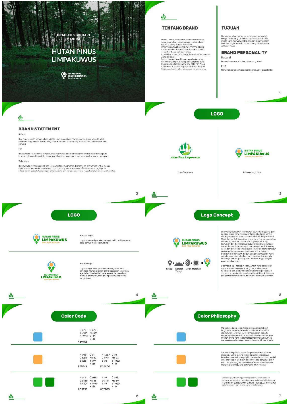
Gambar 5.2.1 GSM Graphic Standar Manual