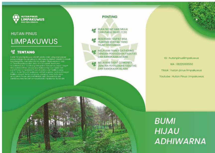
Gambar 5.9.1 Brosur