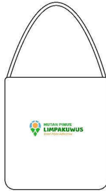
Gambar 5.4.1 Tote bag