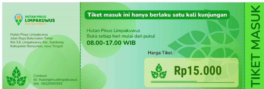
Gambar 5.8.1 Tiket

Media : Tiket Ukuran : 12 x 5 cm Penempatan : Locket Ilustrasi : Logo Hutan Pinus Limpakuwus Tipografi : Ballo Bhaijan 2, Open Sans Visualisasi : Adobe Illustratir CC