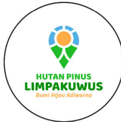
Gambar 5.13.1 Gantungan Kunci