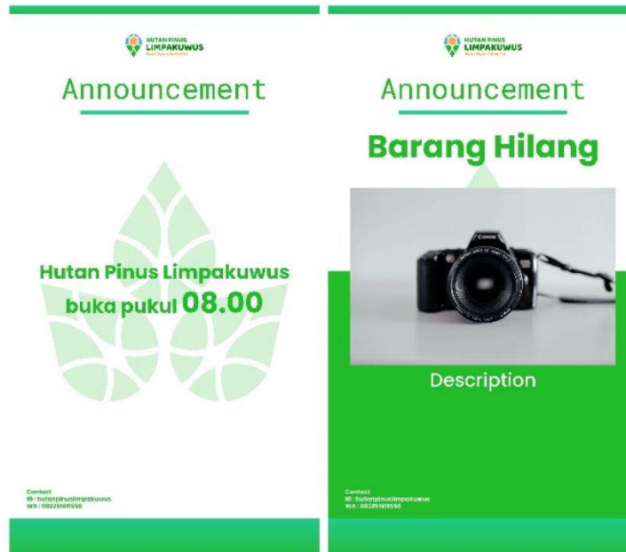
Gambar 5.1.2 Instagram Feed