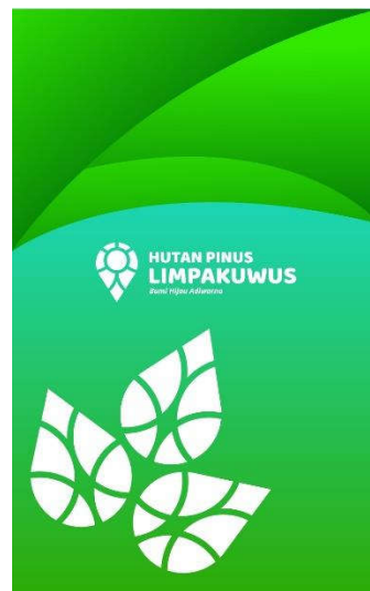
Gambar 5.10.2 ID Card Sumber: Dokumen Pribadi

Media : ID Card Ukuran : 5,5 x8,5 Cm Penempatan : Digunakan pihak pengelola Ilustrasi : Logo Hutan Pinus Limpakuwus dan Foto Tipografi : Ballo Bhaijan 2, Open Sans Visualisasi : Adobe Illustratir CC