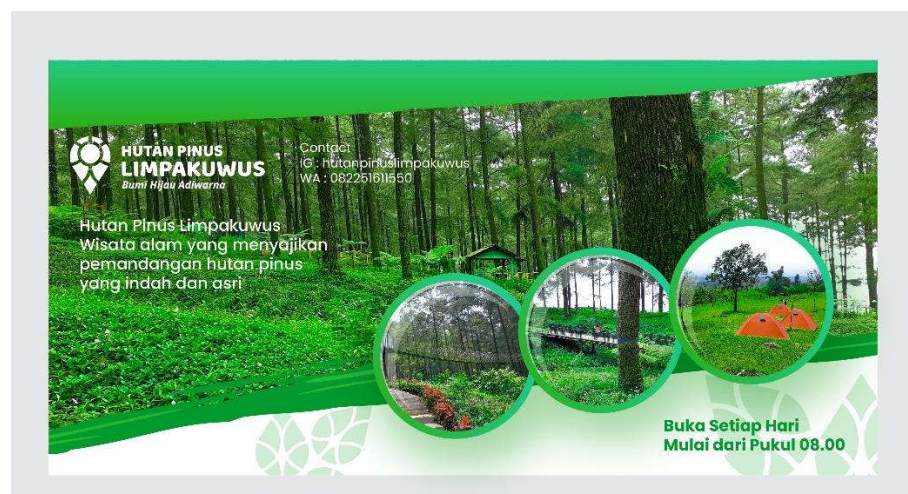
Gambar 5.3.1 Banner

Media : Banner Ukuran : 1x2 meter Penempatan : Jalan Raya Ilustrasi : Logo Hutan Pinus Limpakuwus dan Foto Tipografi : Ballo Bhaijan 2, Poppins, Open Sans Visualisasi : Adobe Illustratir CC