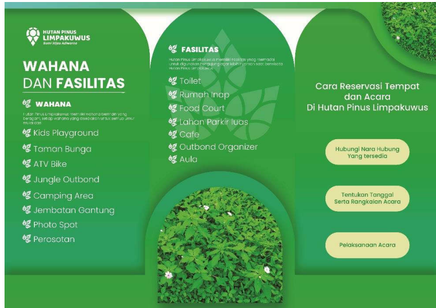
Gambar 5.9.2 Brosur