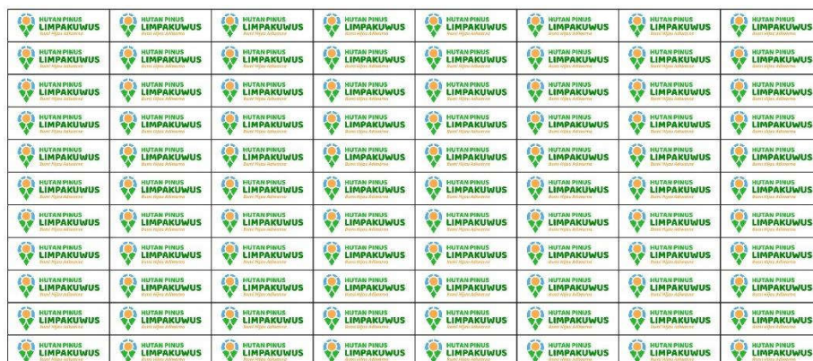
Gambar 5.14.1 Sticker