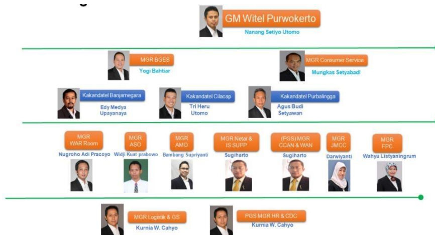
Gamabar 1.3 Struktur Organisasi Finance