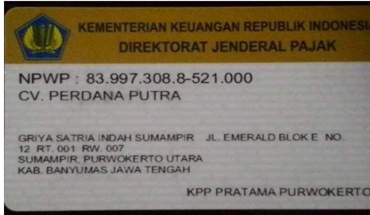
Gambar 1.1. Informasi Perusahaan

CV. Perdana Putra adalah perusahaan di bidang konveksi perlengkapan sepeda yang menyediakan berbagai produk yang di jual online melalui website bukalapak. CV Perdana Putra mempunyai brand bernama Powerplay dan Limcycle yang merupakan nama brand dari produk yang dibuat. Powerplay berdiri pada tahun 2016 yang berlokasi di Griya Satria Indah Sumampir JL. Emerald Blok E No. 12 RT.001, RW 007 Sumampir, Purwokerto Utara Kab. Banyumas Jawa Tengah.