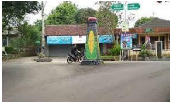
Gambar 1. 1. Tugu Gewok Karanggintung

Desa Karanggintung terletak di kecamatan Sumbang Kabupaten Banyumas, desa ini berbatasan langsung dengan Desa Datar disebelah timur, berbatasan dengan Desa Kedungmalang di sebelah selatan, berbatasan dengan Desa Banjarsari Kulon di sebelah utara, dan Desa Pandak di sebelah barat.