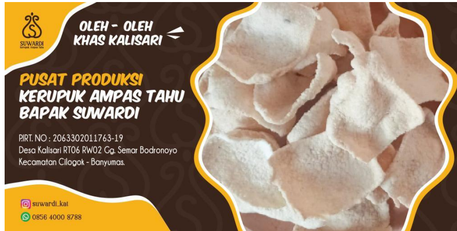
Gambar 5.14 Banner