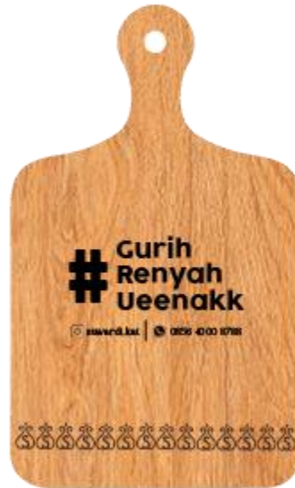
Gambar 5.10 Talenan