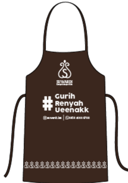
Gambar 5.9 Apron