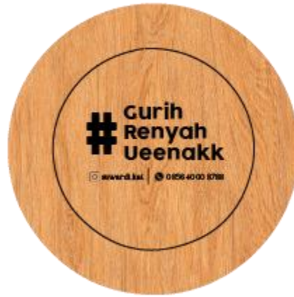
Gambar 5.12 Piring