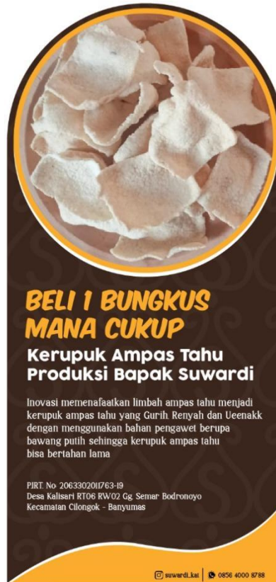
Gambar 5.13 Flyer