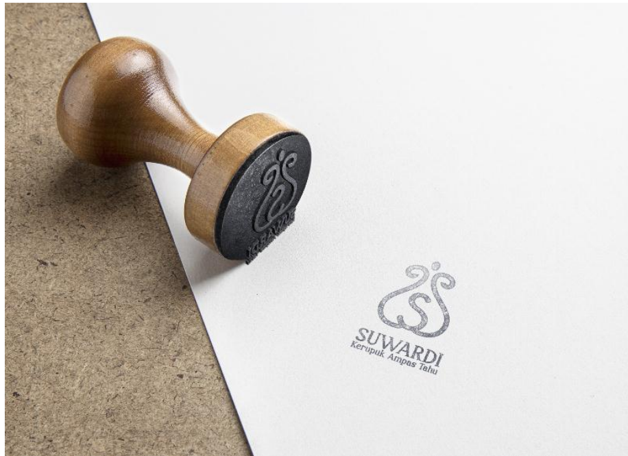
Gambar 5.7 Stempel