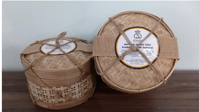
Gambar 5.4 Packaging