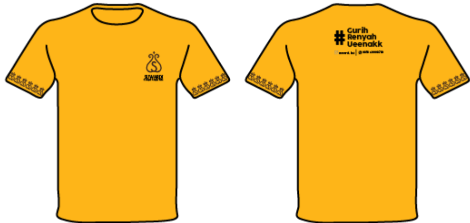
Gambar 5.8 Kaos