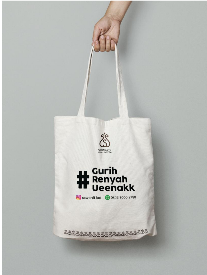
Gambar 5.5 Totebag