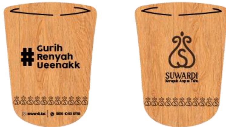
Gambar 5.11 gelas