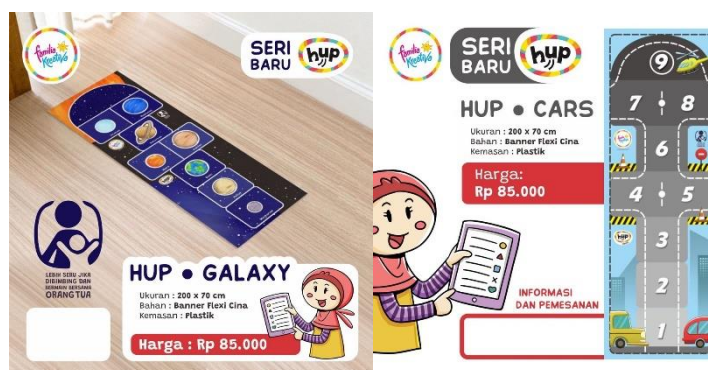
Gambar 2.5 Beberapa desain alas main Hup