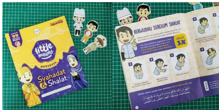
Gambar 2.4 Workbook Little Muslim