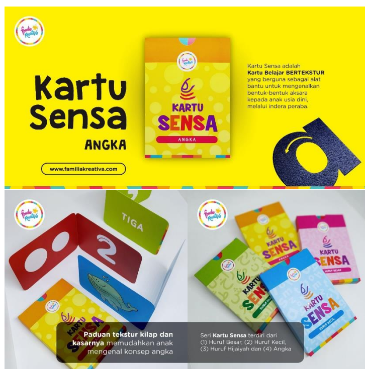
Gambar 2.5 Kartu Sensa