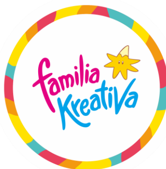
Gambar 2.1 Logo Familia Kreativa

Familia Kreativa adalah sebuah komunitas yang bergerak di bidang pendidikan ekstrakurikuler kreatif untuk anak usia tiga hingga sembilan tahun. Familia Kreativa menyelenggarakan berbagai kegiatan anak dan keluarga mulai dari Playdate Kreativa, Amengan, Gagas Karya, dan aktivitas temporer lainnya. Selain menyediakan aktivitas anak dan orang tua, Familia Kreativa telah membuat lebih dari seratus printable edukasi dalam ranah kreativitas anak yang dapat diunduh secara gratis di website www.familiakreativa.com . Untuk mendukung aktivitas komunitas, Familia Kreativa membangun bisnis yang bergerak dibidang penerbitan buku dan pembuatan produk pendamping proses belajar. Familia Kreativa dapat ditemui melalui akses ke akun Instagram @familiakreativa dan website www.familiakreativa.com .