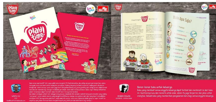
Gambar 2.3 Buku Kreativitas Anak Play Time

Familia Kreativa memiliki tiga lini utama yakni lini produk gratis, produk komersial, dan produk aktivitas jasa atau event . Produk gratis adalah produk yang diberikan dan disebarluaskan dengan tidak memungut biaya, lini produk ini dapat diunduh di website resmi Familia Kreativa. Produk lini komersial yang telah dibuat oleh Familia Kreativa seperti buku, kartu, poster, stiker, dan alas bermain. Sedangkan untuk lini event terdapat berbagai jenis kegiatan yang di antaranya: Pojok Kreativa, Amengan, Gagas Karya, FK Berbagi, Sharing Kreativa, Creative Drawing , Storytelling Interaktif, dan kerja sama perusahaan.