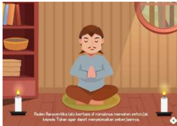
Gambar 5.7 Isi Halaman 4