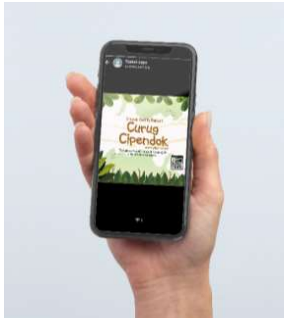
Gambar 5.22 Mockup E-flyer