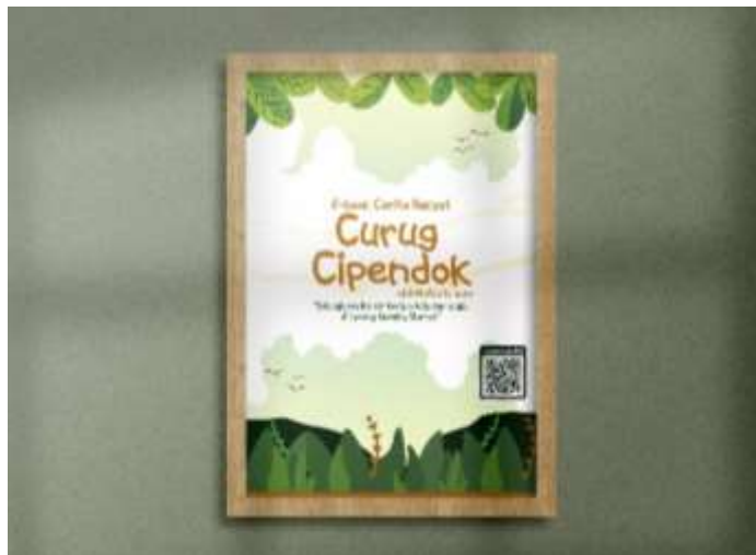
Gambar 5.20 Mockup Poster

Media : Poster Ukuran : A3 ( 29,7 x 42 cm) Realisasi : ivory 210 gsm Desain :