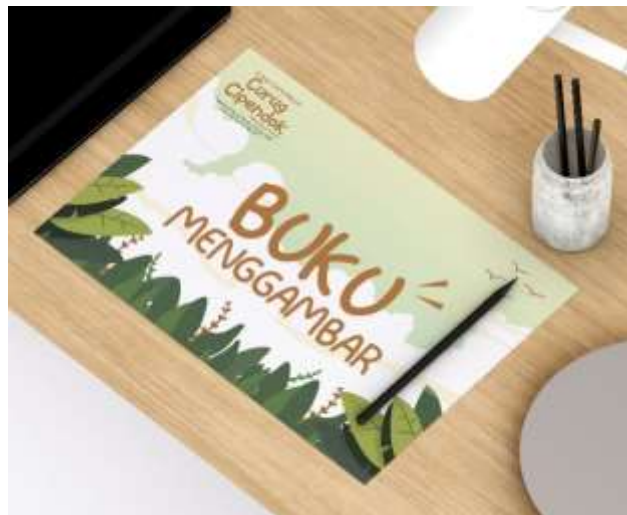
Gambar 5.29 Mockup Buku Menggambar