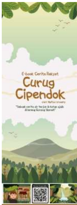
Gambar 5.19 Desain X-banner