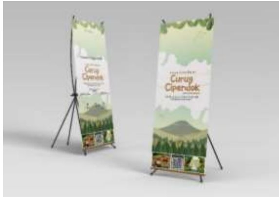
Gambar 5.18 Mockup Banner