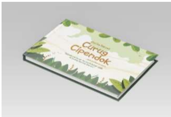
Gambar 5.2 Mockup E-book Versi Cetak