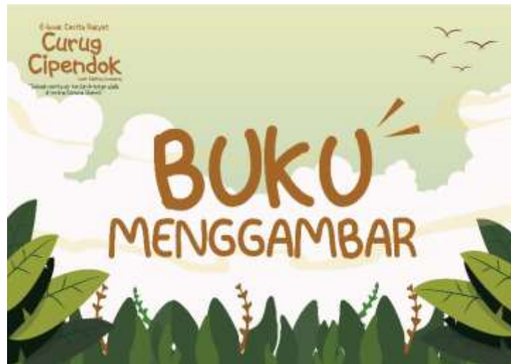
Gambar 5.30 Desain Sampul Depan Buku Menggambar