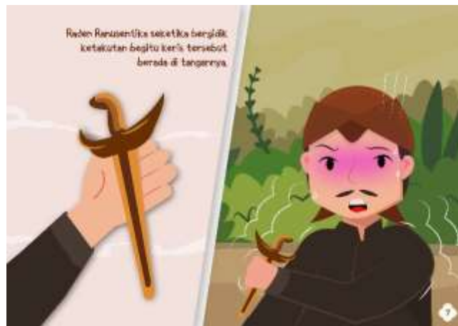
Gambar 5.10 Isi Halaman 7