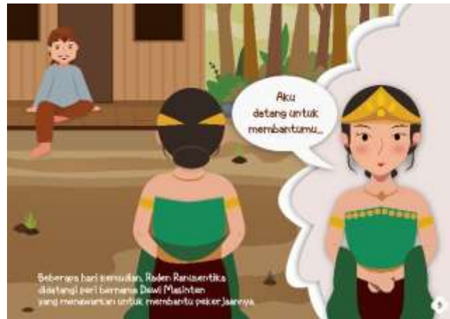
Gambar 5.12 Isi Halaman 9