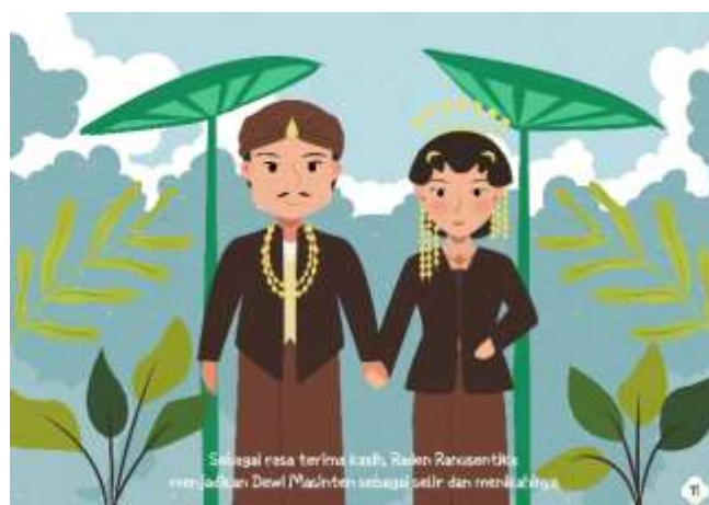
Gambar 5.14 Isi Halaman 11 (Sumber: Hasil Desain Penulis)