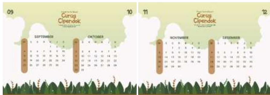
Gambar 5.28 Desain Halaman 5 dan 6 Kalender Duduk