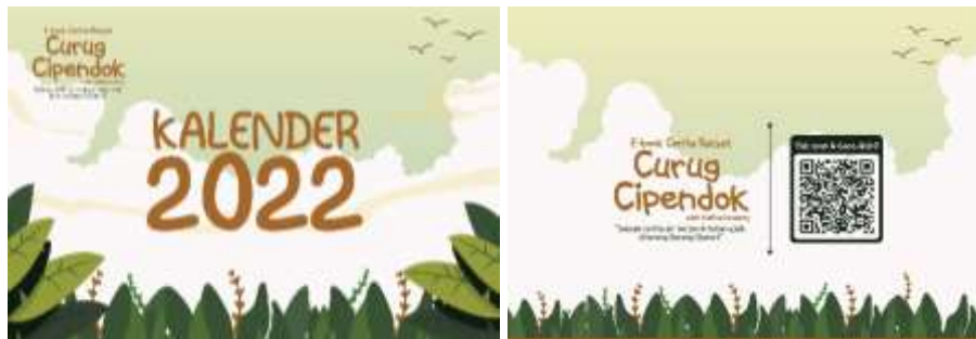
Gambar 5.25 Desain Sampul Depan dan Belakang Kalender Duduk (Sumber: Hasil Desain Penulis)

Media : kalender duduk Ukuran : A5 ( 21 x 15 cm) Realisasi : ivory 210 gsm Desain :