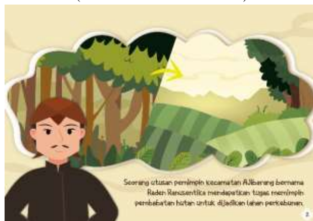
Gambar 5.5 Isi Halaman 2