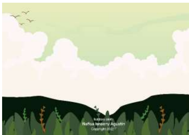
Gambar 5.17 Isi Sampul Belakang