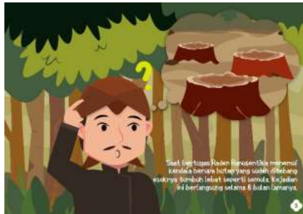
Gambar 5.6 Isi Halaman 3