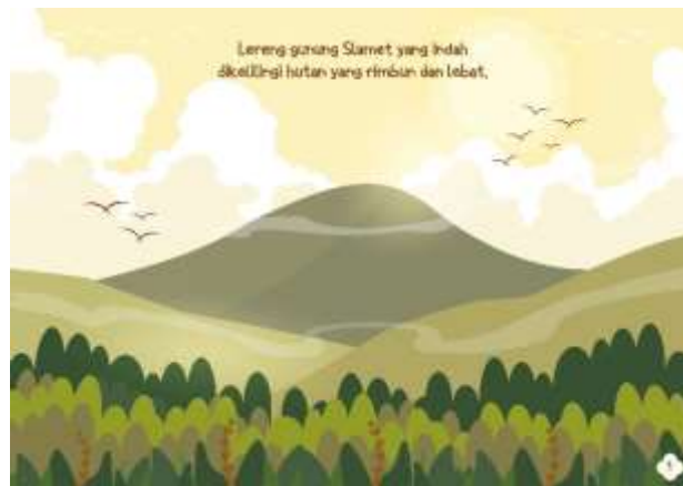
Gambar 5.4 Isi Halaman 1