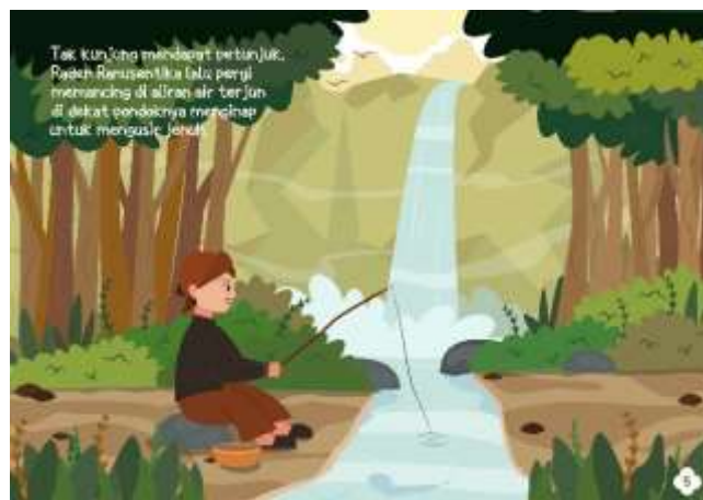
Gambar 5.8 Isi Halaman 5