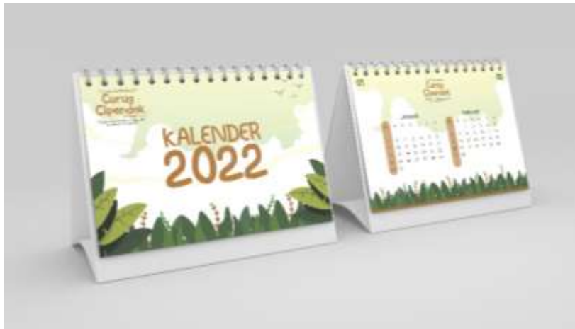
Gambar 5.24 Mockup Kalender Duduk

Media : kalender duduk Ukuran : A5 ( 21 x 15 cm) Realisasi : ivory 210 gsm Desain :