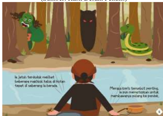
Gambar 5.11 Isi Halaman 8