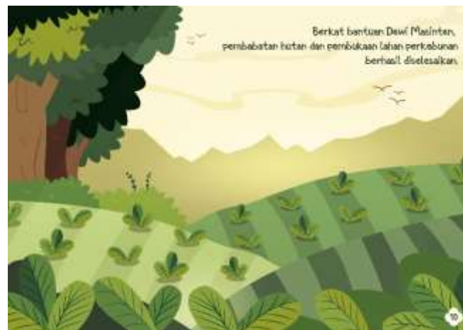
Gambar 5.13 Isi Halaman 10