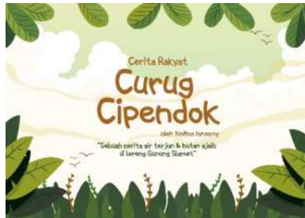
Gambar 5.3 Sampul Depan