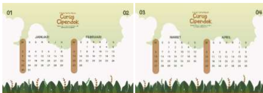
Gambar 5.26 Desain Halaman 1 dan 2 Kalender Duduk