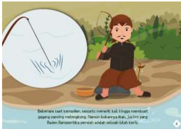
Gambar 5.9 Isi Halaman 6