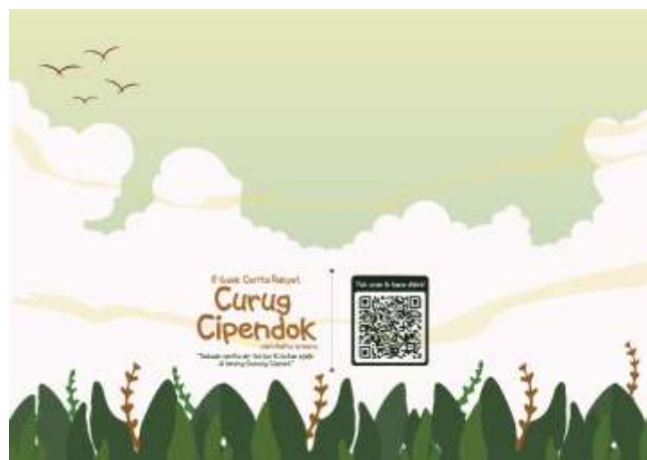
Gambar 5.31 Desain Sampul Depan Buku Menggambar