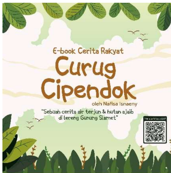
Gambar 5.23 Desain E-flyer