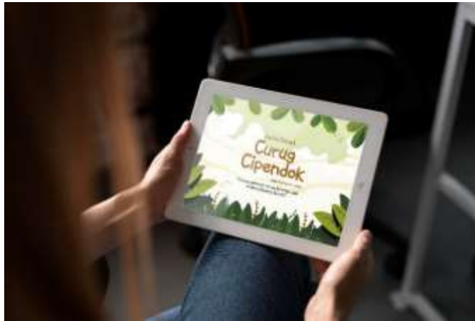
Gambar 5.1 Mockup E-book