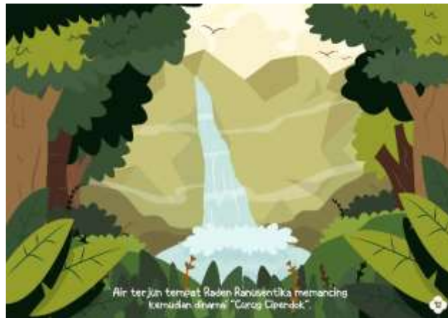
Gambar 5.15 Isi Halaman 12