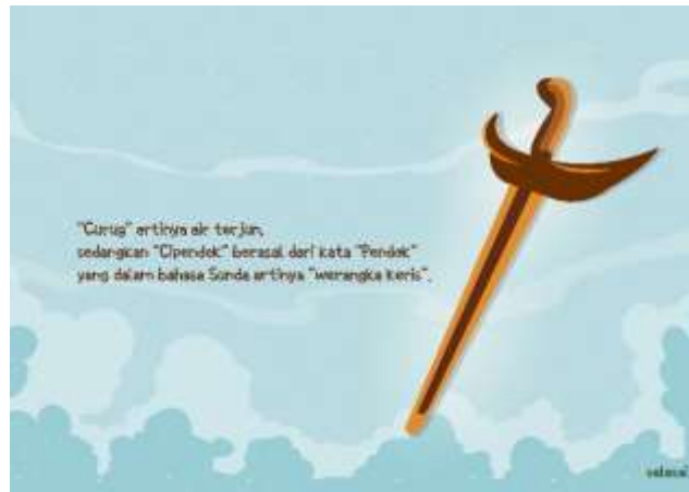
Gambar 5.16 Isi Halaman Akhir (Sumber: Hasil Desain Penulis)