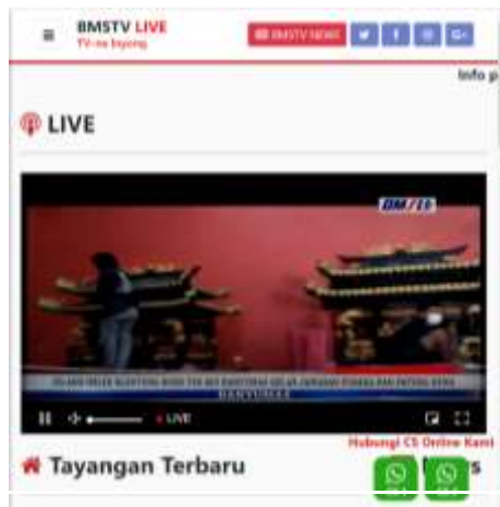
Gambar 3 Website BMSTV

Hasil program acara akan ditayangkan di saluran televisi Banyumas TV, website Banyumastv.com dan channel youtube Banyumas TV. Penayangan hasil program acara ditayangkan melalui beberapa tahapan dan hasil yang sudah jadi akan di review terlebih dahulu oleh tim produksi untuk disetujui dan ditayangkan.