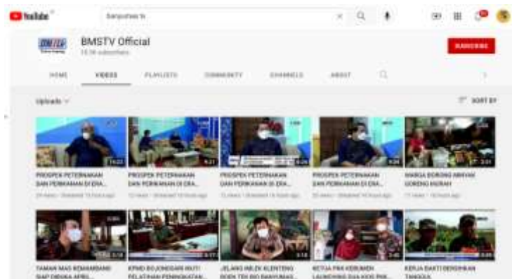
Gambar 4 Channel Youtube BMSTV