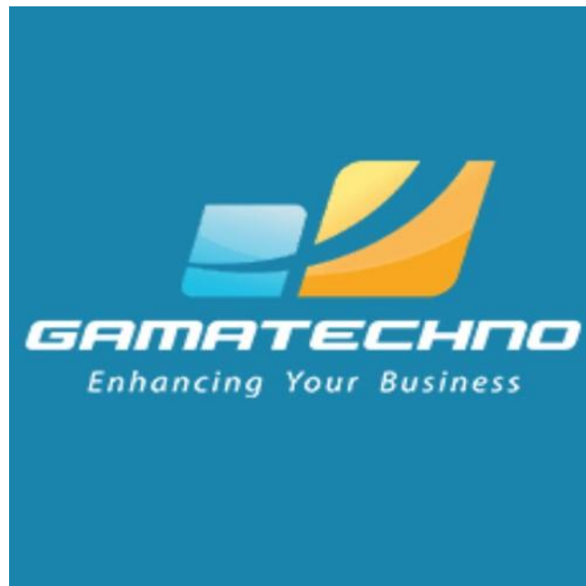
Gambar 1.1 Logo PT. Gamatechno Indonesia Yogyakarta

Gamatechno merupakan perusahaan penyedia solusi teknologi informasi yang berkantor pusat di Yogyakarta dan memiliki kantor cabang di Jakarta dan Bali. Resmi berdiri pada 4 Januari 2005 berawal dari pengembangan sistem informasi untuk segmen perguruan tinggi. Saat ini