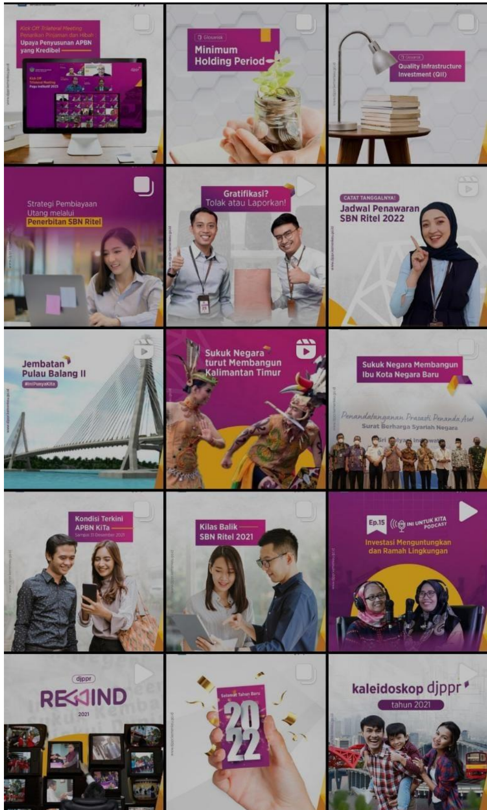
Gambar 3. Desain social media management untuk Ditjen Pengelolaan Pembiayaan dan Risiko Kementerian Keuangan