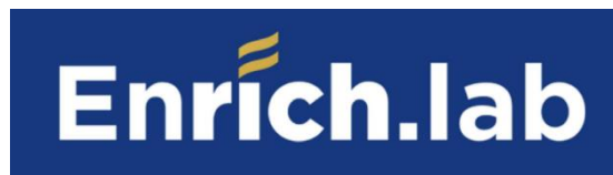
Gambar 2. 1 Logo Perusahaan

Enrich.Lab adalah sebuah perusahaan Creative Agency yang masuk dalam badan hukum Perseroan Terbatas yaitu PT. Bisnis Akseleran Indonesia yang telah berdiri sejak tahun 2019 dengan ruang lingkup kegiatan usaha mencakup Digital Marketing .