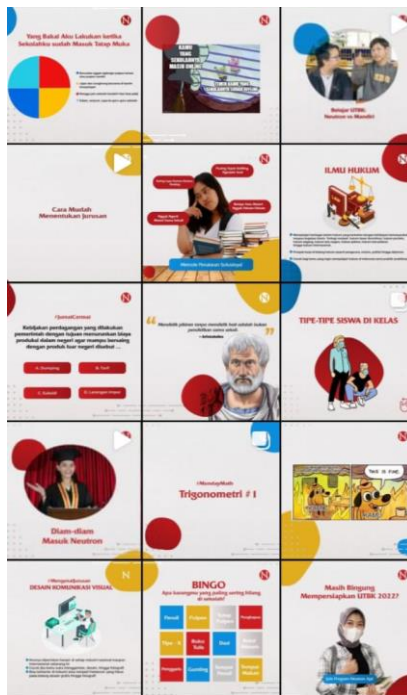
Gambar 2. 3 Desain Social Media Management untuk klien Neutron Yogyakarta

Hasil produksi dalam setiap kegiatan usaha meliputi, desain grafis, dan aset digital Lainnya.