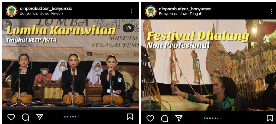
Gambar 2.2 Event bagian kebudayaan