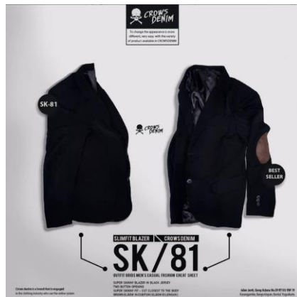
Gambar 2.3 Produk Seven Inc

Seven Inc memiliki beberapa label seperti: Crows Denim yang berfokus pada clothing bertema anime, lalu Goog On yaitu clothing seputar Korean Style, Full Metal Spirit berupa t-shirt bernuansa Indonesia. Berikut merupakan beberapa produk apparel Seven Inc: