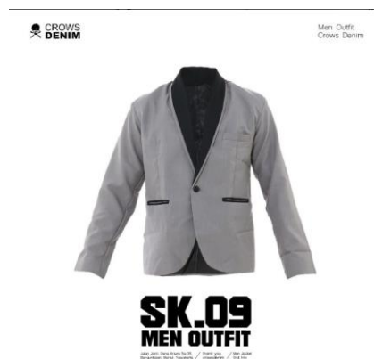
Gambar 2.5 Produk Seven Inc

Seiring dengan berjalannya waktu, beberapa brand juga mulai dikembangkan seperti: