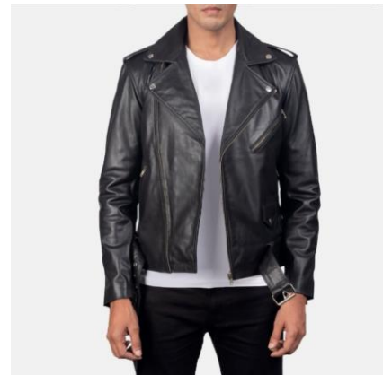
Gambar 2.4 Produk Seven Inc