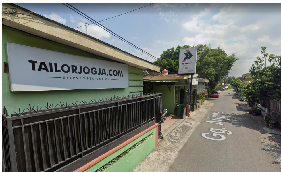
Gambar 2.2 Lokasi Seven Inc

Perusahaan online clothing ini awalnya berkantor di kos-kosan Gang Bimo, Banguntapan. Dengan terus bertambahnya karyawan yang dimiliki, Seven Inc beberapa kali berpindah kantor sesuai dengan kebutuhan hingga memiliki kantor tetap di tahun 2014 yang beralamat di Jl. Raya Janti, Gang Arjuna No. 59, Karangjambe, Banguntapan, Bantul, Yogyakarta 55198. Kantor ini berfungsi sebagai kantor pusat, sebagai kantor urusan administrasi sekaligus toko offline tempat customer yang ingin berbelanja dengan sistem transaksi langsung atau Cash on Delivery ditambahlah sebuah kantor bertingkat dua, di selatan SMA BOPKRI BANGUNTAPAN yang diberi nama SEVEN HOUSE. SEVEN HOUSE selain berfungsi untuk tempat training karyawan juga dipakai sebagai tempat produksi.