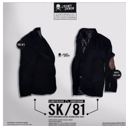
Gambar 2.3 Produk Seven Inc

Perusahaan Seven Inc kini memiliki beberapa label, yaitu : Crows Denim yang berfokus pada clothing yang bertemakan anime, Goog On yaitu clothing seputar Korean Style, Full Metal Spirit berupa t-shirt yang bernuansa Indonesia. Berikut merupakan beberapa produk apparel Seven Inc :