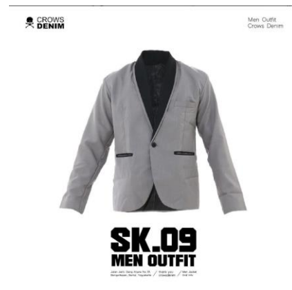
Gambar 2.4 Produk Seven Inc