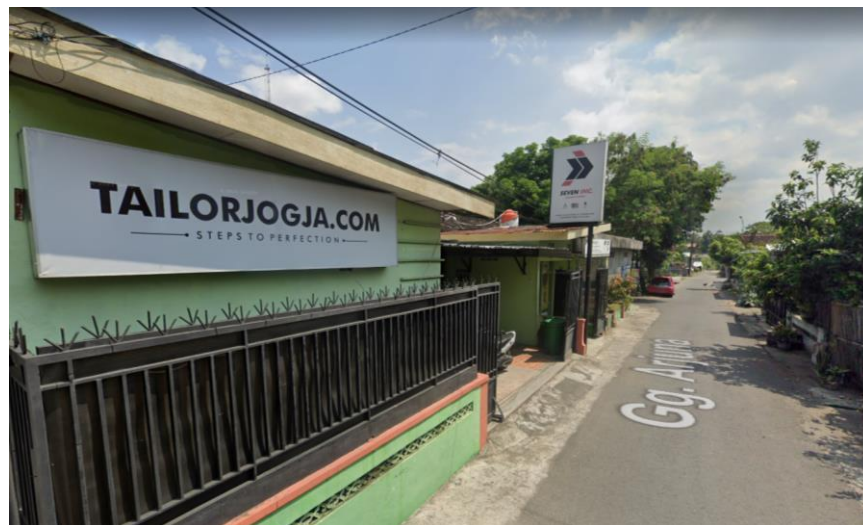
Gambar 2.2 Gambar Seven Inc

Di tahun 2014, SEVEN INC memiliki kantor tetap yang beralamat di jln Raya janti, gang arjuna no 59, karangjambe, Banguntapan, Bantul, Yogyakarta 55198. Kantor ini berfungsi sebagai kantor pusat yang dimana kegiatan operasional administrasi berlangsung dan sekaligus store tempat pembeli ini berbelanja dengan system transaksi langsung atau Cash on Delivery .