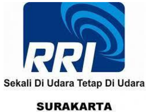
Gambar 2.1 Logo

RRI Surakarta RRI Surakarta merupakan salah satu radio yang berada di kota Surakarta Surabaya. RRI Surakarta resmi lahir pada tanggal 11 September 1945, Alamat Jl. Abdul Rahman Saleh 51, Surajada. RRI Surakarta memiliki Tiga format siaran, PRO 1, PRO 2 dan PRO 3. PRO 1 AM 972 KHz FM 101 MHz dengan format berisi informasi, Pendidikan, Kebudayaan dan Rekreasi. Status sosial pendengarnya adalah kalangan menengah ke bawah.