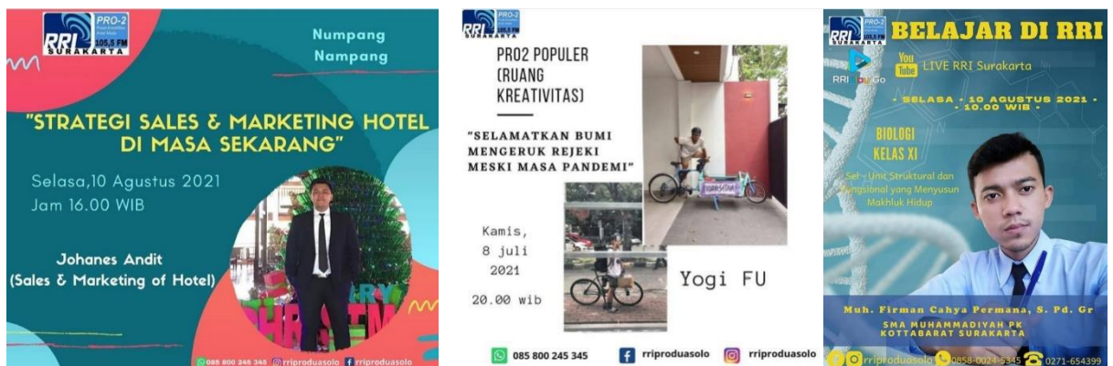
Gambar 2.3 E-Flyer RRI Surakarta

Dalam pembuatan E-Flyer, RRI Surakarta membuat tiga jenis tema E-Flyer. Tema tersebut diantaranya, acara siaran Numpang Numpang, acara siaran Belajar di RRI Pro 2 dan acara Dialog kebudayaan. Informasi yang tertera pada E-Flyer dibuat berdasarkan topik siaran yang akan dibahas dengan narasumber pada saat melakukan siaran. E-Flyer tersebut diunggah pada akun instagram @rriproduasolo. Dibawah ini merupakan contoh E-Flyer yang dibuat oleh staff desain RRI Pro 2 Surakararta.