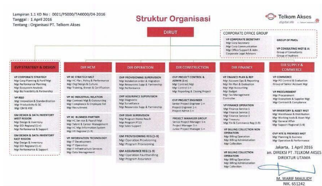
Gambar 2. 2 Struktur Organisasi

PT. Telkom Akses adalah organisasi yang memiliki struktur organisasi terdiri dari beberapa departemen yang memiliki wewenang dan tanggung jawab langsung secara vertikal dikaitkan dengan tugas jabatan tiap tingkatan atasan dan bawahan, berikut merupakan struktur organisasi di PT. Telkom Akses.