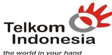
Gambar 2.1 Logo PT. Telkom Indonesia, Tbk

PT Telkom Indonesia (Persero), Tbk ialah perusahaan Badan Usaha Milik Negara (BUMN) yang berfokus pada sektor bidang jasa layanan teknologi informasi dan jaringan telekomunikasi di Indonesia. Selain itu, Telkom juga menjalankan usaha bisnis yang bergerak di bidang multimedia seperti konten dan aplikasi. Perusahaan ini memiliki pemilik saham utama Telkom yaitu dengan Pemerintahan RI sebesar 52.09%, sedangkan publik sekitar 47.91%. Sehingga, saham tersebut diperjual belikan di platform Bursa Efek Indonesia (BEI) dengan kode “TLKM” dan New York Stock Exchange (NYSE) dengan kode “TLK” (PT Telkom Indonesia (Persero) Tbk., 2020).