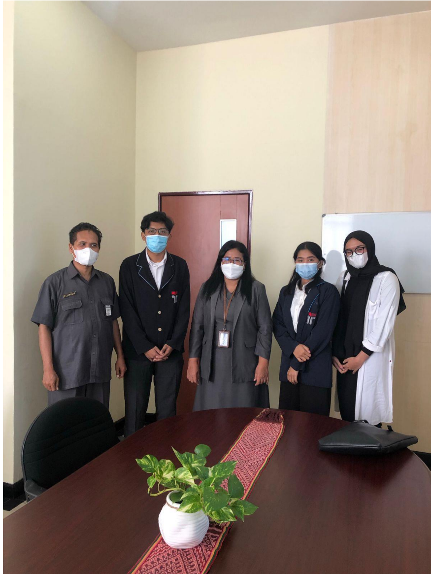
Foto bersama pihak internal BPS 1