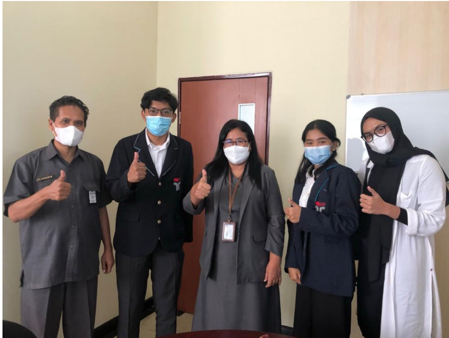
Foto bersama pihak internal BPS 2