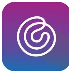
Gambar 1. 1 Logo PT. CAZH Teknologi Inovasi