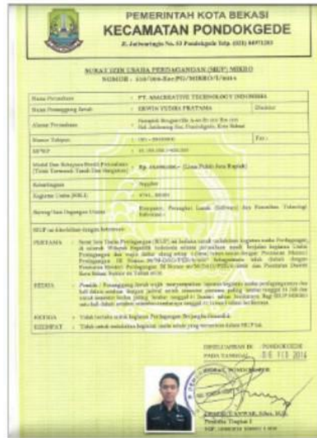
Gambar 1. 2 SIUP PT. Asacreative Technology Indonesia.